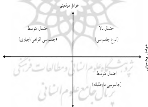
شکل ۱. مدل احتمال خیانت به کشور

در این مقاله مدل ارزیابی احتمال خیانت به کشور، یک مدل ادراکی است که از طریق مرور ادبیات و مطالعات نظری مرتبط بر ساخت و تولید شده است. براساس مرور ادبیات پژوهش و همچنین مرور نظریات جرم و انحرافات اجتماعی، دو بعد مدل ارزیابی احتمال خیانت به کشور عبارت است از: بعد موقعیتی و بعد وضعیتی. از ترکیب این مؤلفه‌ها می‌توان علاوه بر احتمال وقوع خیانت به کشور، نوع جاسوسی و خیانت را نیز تحلیل و برآورد نمود.