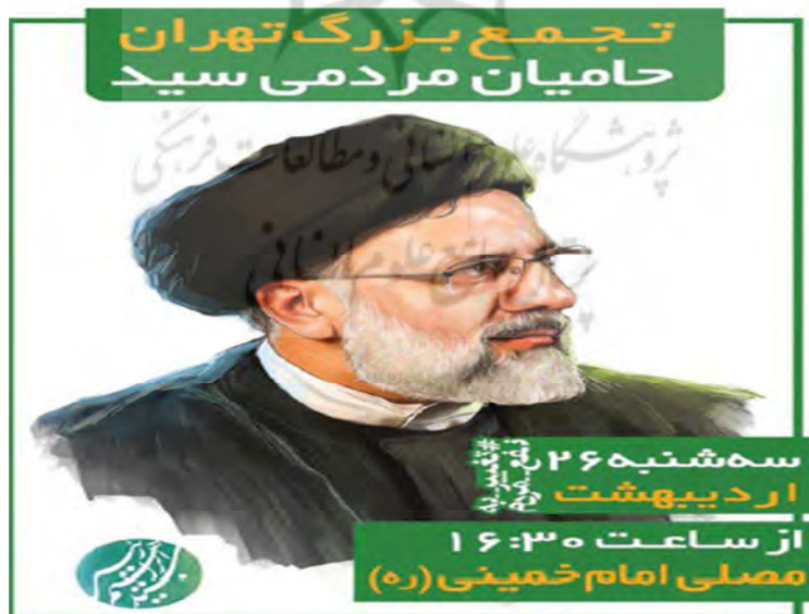
تصویر شماره (۴). آگهی «حامیان مردمی سید»