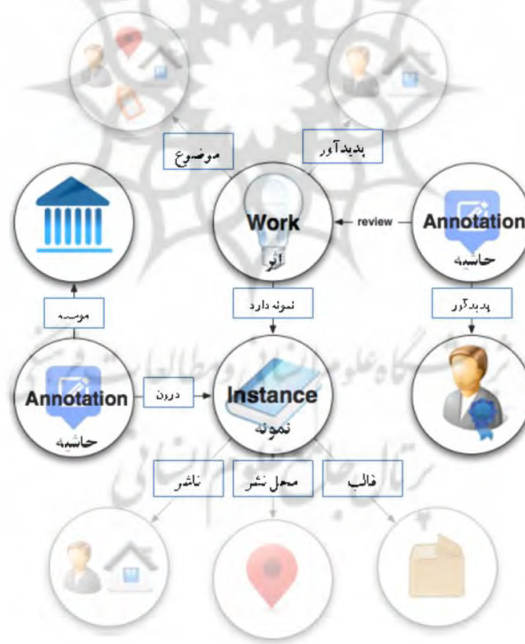
تصویر ۲. نمایشی گرافیکی از پیوند حاشیه نویسی با اثر و نمونه