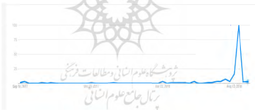
شکل ۱. روند جست‌وجوی کلیدواژه «عید قربان» در «گوگل ترندز»

دوره‌ای و زمانی منجر به ایجاد پیشنهادهای پرسش غیر مرتبط در آن دوره‌ها می‌گردد. همان‌طور که در شکل ۱، ملاحظه می‌شود، با توجه به روند جست‌وجوی کلیدواژه «عید قربان» در طول ۱۲ ماه در «گوگل ترندز» ۱ ، عامه‌پسندی این کلیدواژه به مرور زمان تغییر پیدا کرده است؛ به گونه‌ای که در دوره‌ای از سال بیشترین جست‌وجو را داشته و باید هنگام ایجاد پیشنهادهای پرسش مورد توجه قرار گیرد. در پدیده‌های چرخه‌ای مشابه با این کلیدواژه، اگر پیشنهادهای پرسش فقط بر اساس عامه‌پسندی گذشته بوده و عامل زمان در نظر گرفته نشود، ممکن است کلیدواژه‌های پیشنهادی متناسب با نیاز کاربر در آن زمان نباشد. اما اگر در ایجاد پیشنهادهای پرسش عامل زمان در نظر گرفته شود، پیشنهادهای پرسش متناسب با آن زمان به کاربر ارائه می‌گردد. به‌علاوه، در رویدادهای چرخه‌ای دیگر مانند عید نوروز، کریسمس، هفته دفاع مقدس یا هر رویداد دوره‌ای و فصلی دیگر، با گنجاندن عامل «زمان» در ایجاد پیشنهادهای پرسش، کلیدواژه‌های پیشنهادی مرتبط می‌توانند در رتبه‌های بالاتر قرار گرفته و در بقیه‌ایام شاید حتی نیازی به نمایش آن‌ها نباشد.