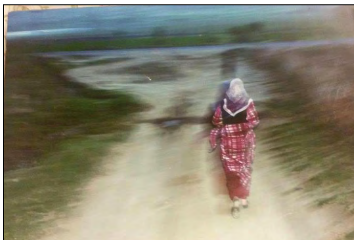
تصویر ۱: تابلو "راه"، هیژا رحیمی، ۱۳۸۹