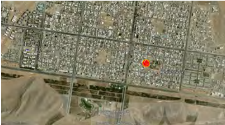
شکل ۲: جانمایی محله پردیس در شهر جدید بهارستان

شناسایی و تدوین اصول طراحی یک مرکز محله موفق شهری با مقایسه تطبیقی دو مرکز محله مدرن و پست مدرن (نمونه موردی: مرکز محله سنگ تراش ها در شهر اصفهان و مرکز محله پردیس در شهر جدید بهارستان) نوید جهدی، مهدی ساشورپور صص ۴۹-۷۱