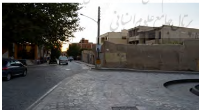
شکل ۱۱ تا ۱۴: تصاویری از مرکز محله سنگ تراش ها