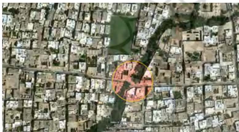
شکل ۱۰: بزرگنمایی مرکز محله سنگ تراش ها