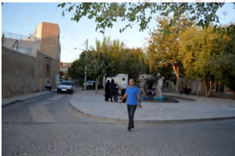
شکل ۱۸: طراحی برای ماشین و عدم نظارت اجتماعی ساکنان در مرکز محله پردیس (تصویر بالا) و پیاده‌مداری و سرزندگی در مرکز محله سنگ‌تراش‌ها (تصویر پایین)