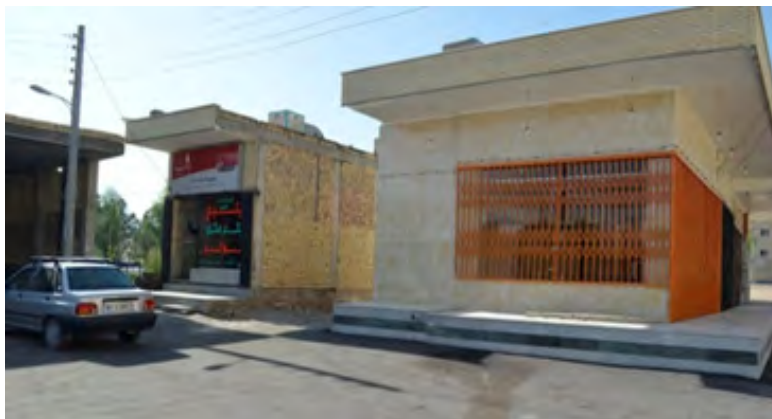
شکل ۴ تا ۸: تصاویری از مرکز محله پردیس بهارستان