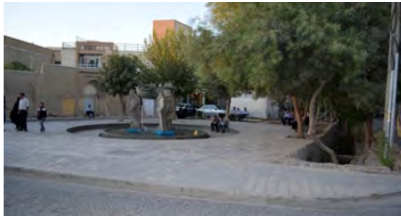
شکل ۱۱ تا ۱۴: تصاویری از مرکز محله سنگ‌تراش‌ها