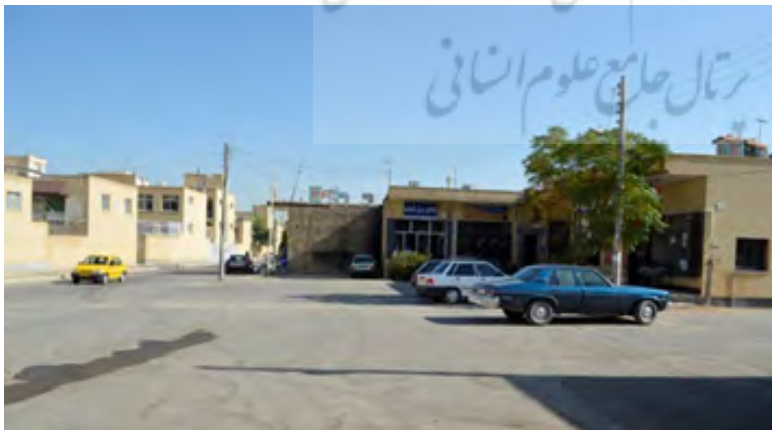
شکل ۴ تا ۸: تصاویری از مرکز محله پردیس بهارستان