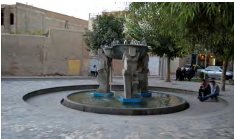
شکل ۱۵: کفسازی و جداره‌سازی فاقد جزییات و طراحی نشده برای ماشین در مرکز محله پردیس (تصویر بالا) و کفسازی با جزییات و حضور آب نما و عناصر سبز و مادی در مرکز محله سنگ‌تراش‌ها (تصویر پایین)