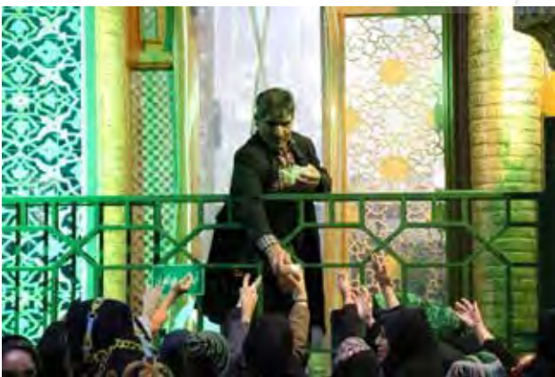
تصویر ۷. تکیه سیدعباسعلی. عکس از: آذرنوش امیری، ۱۳۹۸.

مقطع کوچه در هردوی این عوامل دچار دگرگونی شد. درخت نمادین مراکز محله نیز در ورود اتومبیل به شهر به عنوان مانع انگاشته شده و به منظور تسهیل عبور آن از میان برداشته شد. همچنین خشک‌شدن منابع آبی طبیعی مراکز محله از عواملی بود که به لحاظ اکولوژیکی تأثیر عمیقی بر پوشش‌های گیاهی مراکز محله گذاشت. در این میان به نظر می‌رسد تکایا، به عنوان عاملی آیینی کمترین تأثیر را از عوامل فوق پذیرفته‌اند. چنان‌که در میان تمامی عملکردهای مرکز محله آنچه با گذشت زمان تغییر نیافته و همچنان قابل جمع‌پذیری با زندگی امروز است، عملکردهای آیینی است که در قالب تکیه خود را به نمایش می‌گذارد و موجب حیات نسبی مراکز محله شده است. از طرفی وجود ساختار ذهنی که تحت عنوان موضوعات آیینی و قوانین شرعی بروز می‌یابد توانسته است از حیات این مراکز تا حد زیادی صیانت نماید. از آنجا که اغلب تکیه‌ها در گرگان وقف عام هستند، تخریب یا فروش آنها ممکن نیست. به عبارتی این تکیه‌ها توسط نیروی خودجوش مردمی و توسط خردجمعی حفاظت می‌شوند. چنان‌که نظیف می‌آورد: «این تکایا همه ساله در ایام محرم محلی است که اعضای خانواده خصوصاً بزرگان فامیل را دورهم جمع می‌کند تا برنامه‌ریزی برگزاری مراسم محرم که خود سبک و سیاق خاصی دارد را مدیریت کند و به نوعی مناسبات یکسال محله و فامیل را رقم بزند. احترام به بزرگتر، رعایت سلسله مراتب، پیگیری و رفع و رجوع مشکلات احتمالی در فامیل و محله، حس تعلق اعضا به یکدیگر، مشارکت همگانی در مدیریت مرکز محله و ارتباطات و مبادلات فرهنگی بین محله‌ای از پیامدهای مثبت این تجمع‌هاست» (نظیف، ۱۳۹۰)؛ (تصاویر ۶ و ۷). لازم به ذکر است که در ایام محرم مردم از سراسر شهر در مراکز محله حضور می‌یابند، میان تکیه‌ها