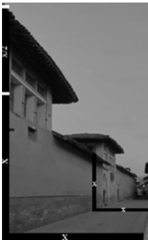
معیار درجه ۱