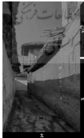
معیار درجه ۲

تصویر ۴. تناسب مقطع کوچه‌های گرگان: در شریان‌های درجه یک این نسبت بین ۱ و ۵، ۵ متغیر است. بناهای موجود غالباً دارای تراکم طبقاتی یک تا دو طبقه هستند و عرض معابر نیز از ۳ تا ۳٫۵ متر متغیر است. در شریان‌های درجه دو از آنجا که عرض معابر تقریباً ۲ متر است. این نسبت بین ۱٫۵ و ۳ متغیر می‌کند، مأخذ: نگارندگان.