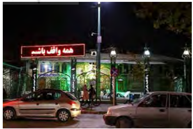
تصویر ۶. اهمیت وقف: سردر تکیه سیدعباسعلی. عکس از: آذرنوش امیری، ۱۳۹۸.