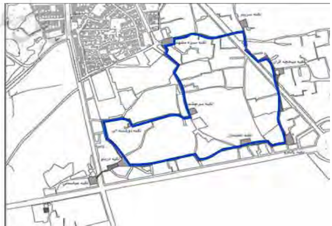
تصویر ۲. راست: مسیر عمومی دسته‌های سینه‌زنی شهر گرگان در شب‌های سوم تا ششم محرم، مأخذ: مقسمی و اسپو محلی، ۱۳۹۵. چپ: مرزبندی محله‌های تاریخی گرگان، مأخذ: موسوی سروینه و همکاران، ۱۳۹۴