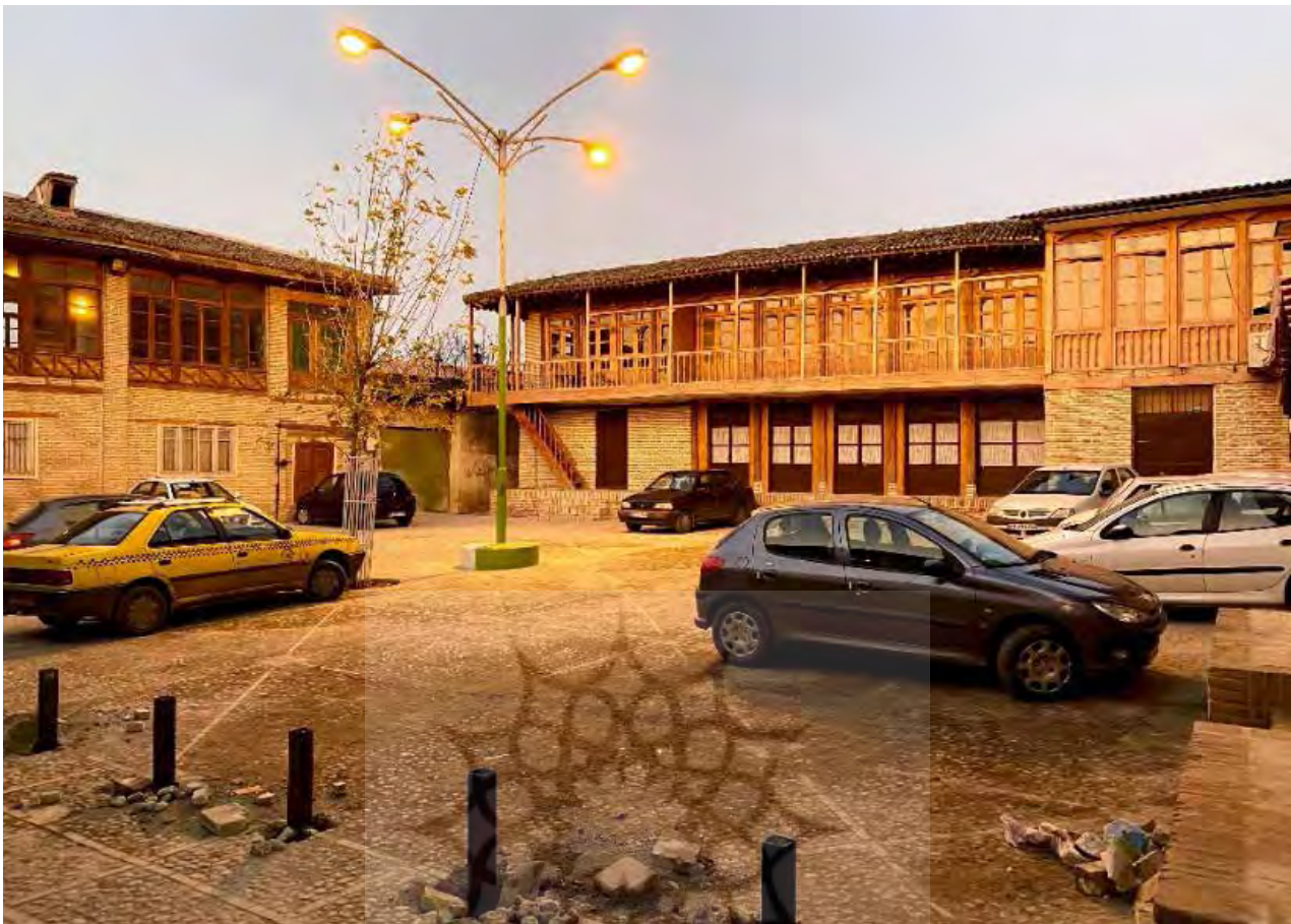
تصویر ۳. تکرر مصالح و برونگرایی دانه‌ها در محلات گرگان، مأخذ: سارا شکوه، ۱۳۹۸.