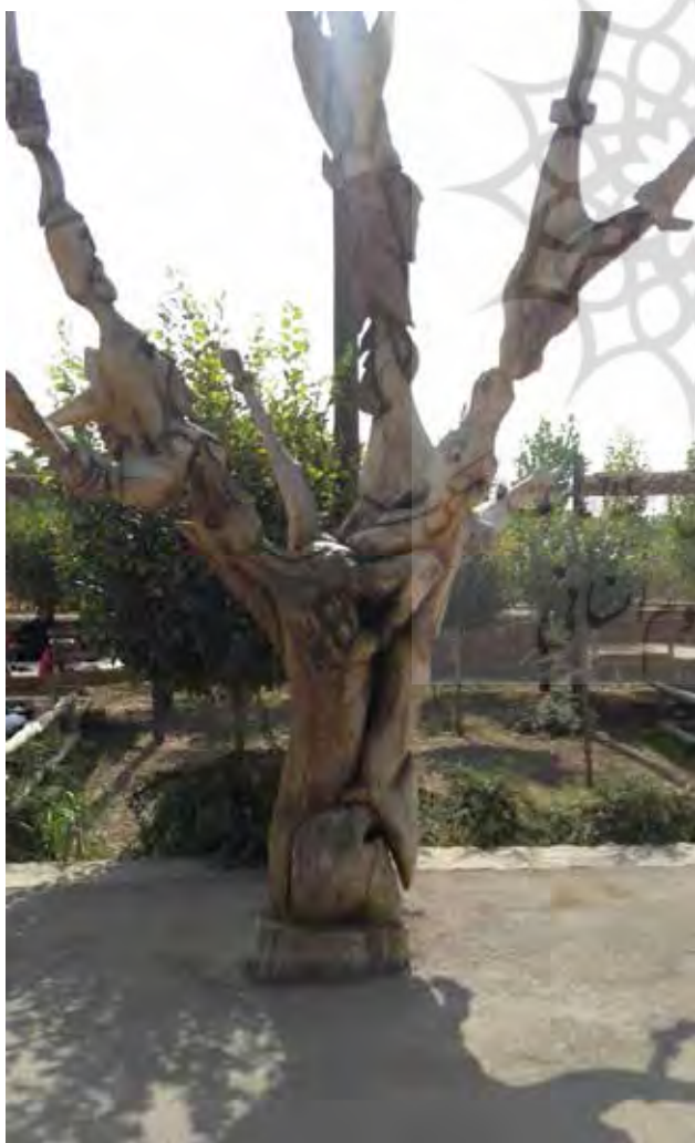
تصویر ۸. استفاده از هنر در تنه درختان خشک‌شده. عکس: طاهره صالحی، ۱۳۹۶.

بوستان مهیاکردن فضایی برای حضور خانواده‌هاست، استقبال خانواده‌ها از این بوستان برای پیکنیک و تفریح نشان می‌دهد. پارک در این هدف اولیه خود به‌رغم پایبندی به منظر باغستان موفق بوده است. جدول ۴ میزان موفقیت بوستان ملا خلیلا در برقراری پیوند با منظر باغستان سنتی قزوین را نشان می‌دهد.