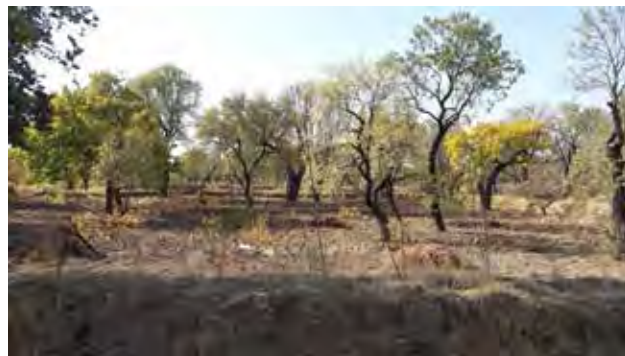
تصویر ۲. الگوی کشت مخلوط در باغستان سنتی. عکس: طاهره صالحی، ۱۳۹۶.