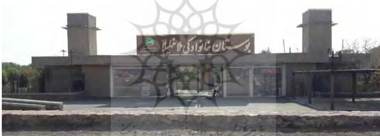
تصویر ۶. ورودی شمالی بوستان ملا خلیلا.

درختان موجود، همانند درختان باغستان قزوین شامل درختان پسته، بادام و گردو است. درختان پسته در باغ پسته به صورت منظم کاشته شده است، بنابراین در حوزه گونه گیاهی، پارک به گونه‌های سنتی پایبند بوده است، اما در شیوه کاشت و منظر عمومی کاشت، پارک با تغییر در ساماندهی گونه‌ها به منظر عمومی باغستان سنتی پایبند نبوده است.