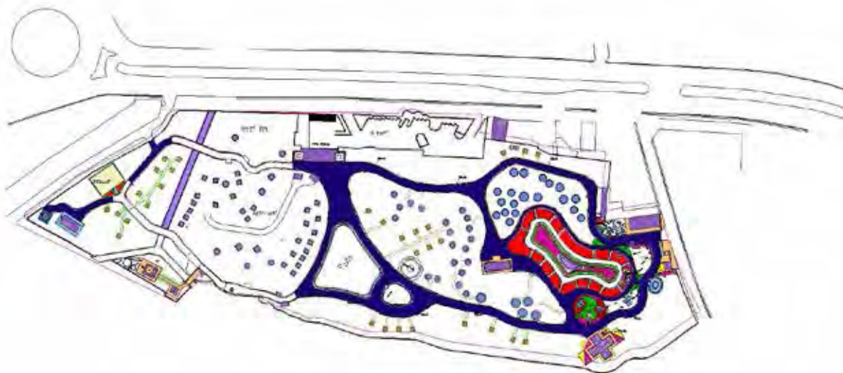
تصویر ۵. پلان بوستان ملا خلیلا.