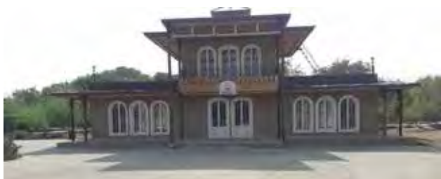
تصویر ۷. عمارت هفت‌درب بوستان ملا خلیلا.