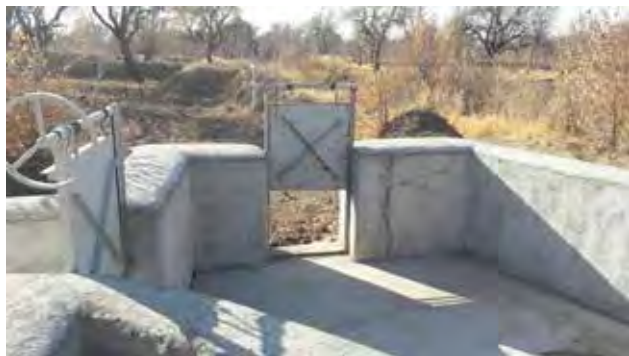
تصویر ۳. حوضچهٔ تقسیم آب. عکس: طاهره صالحی، ۱۳۹۶.

الگوی کشت در باغستان سنتی به‌صورت مختلط و نامنظم است (تصویر ۲) و عمدتاً در یک باغ درختان پسته، بادام، زردآلو و سایر درختان بدون نظم خاصی قرار گرفته‌اند و در