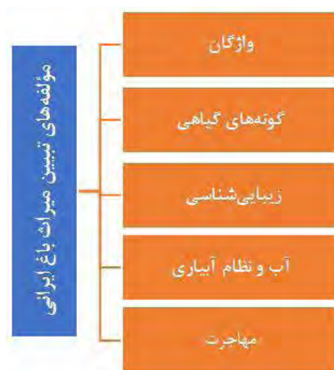
تصویر ۱۳. مؤلفه‌های مورد استفاده برای تبیین میراث باغ ایرانی.

و اسپانیا اثرگذار بوده است. نظام آبیاری و چشمه عمارت‌ها در هر دو سرزمین مشابه باغ‌های ایرانی است و تأثیرپذیری آنها انکارناپذیر است.