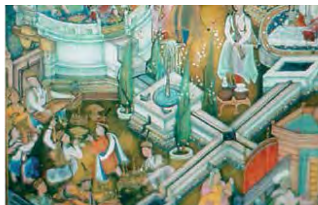
تصویر ۱۵. راست: مینیاتور مربوط به دوره گورکانیان. چپ: مصداق ساخته‌شده آن در مجموعه الکزر شهر سویل اسپانیا. مأخذ: Ruggles, 2008.