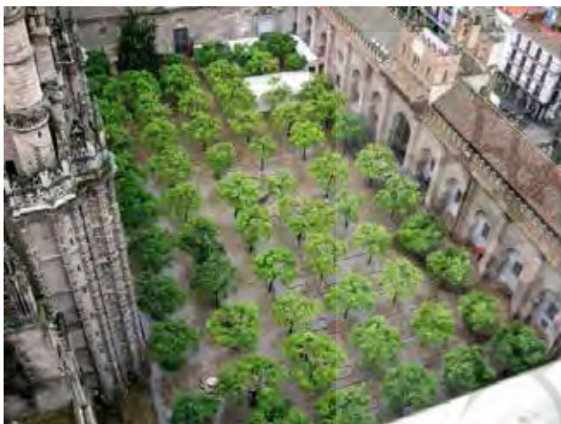
تصویر ۱. نارانجستان کلیسای جامع شهر سویل، اسپانیا.