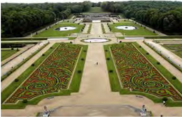
تصویر ۵. باغ ولوویکنت که نخستین باغ به سبک فرانسوی محسوب می‌شود و دارای هزار اصله درخت مرکبات بوده است.

بزرگترین تأثیر را بر غرب و شرق می‌گذارد (Anuarbe, 2003). از مجموعه «مدینه الزهراء» در نزدیکی کوردوبا به‌عنوان مثالی در این زمینه نام برده و اعتقاد دارد که این سنت همچنان در فرهنگ آندلس حفظ شده و بر فرهنگ کاربرد آب و سیستم‌های آبیاری پس از خود در اروپا تأثیرگذار بوده است.