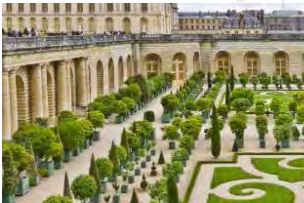
تصویر ۷. نقوش اسلیمی (آرابسک) در میان نارنجستان در باغ ورسای فرانسه.

به‌نظر می‌رسد که قالی‌های ایرانی با طرح باغ (تصویر ۸) از طریق جاده ابریشم به سرزمین‌های اروپایی راه یافته و سپس منبع الهام باغسازان دوره رنسانس از جمله «آندره لونوتر» واقع شده است.