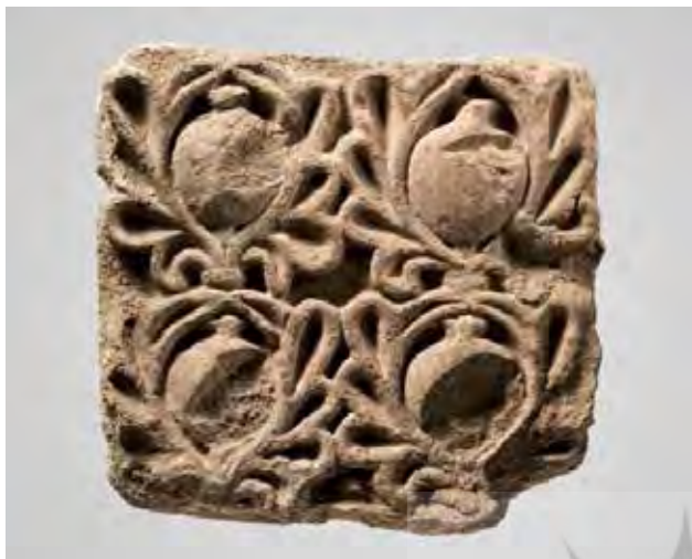
تصویر ۳. نقش انار در دیوارهای کاخ تیسفون، دوره ساسانی. مأخذ: www.metmuseum.org .

دومین عامل انتقال این نقوش را می‌توان در قالی ایرانی جست‌وجو کرد. قالی‌های ایرانی از دیرباز بازتاب باغ ایرانی بوده‌اند و «قالی‌های باغی» یکی از دسته‌های اصلی قالی ایرانی محسوب می‌شود (تصویر ۸).