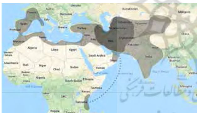
تصویر ۱۴. قلمرو سرزمینی ایران و محدوده اثرگذاری باغ ایرانی.

این تحقیق امکان بسط و تکامل دارد. بدیهی است که تنها چند مورد مختصر از جوانب و شئون فرهنگی باغ ایرانی که در جهان گسترش یافته در این نوشته ذکر شده است. بنابراین برای شناخت بهتر میراث باغ ایرانی نیاز به پژوهش‌های گسترده‌تری است تا عمق نفوذ این محصول فرهنگی در جهان آشکار شود.