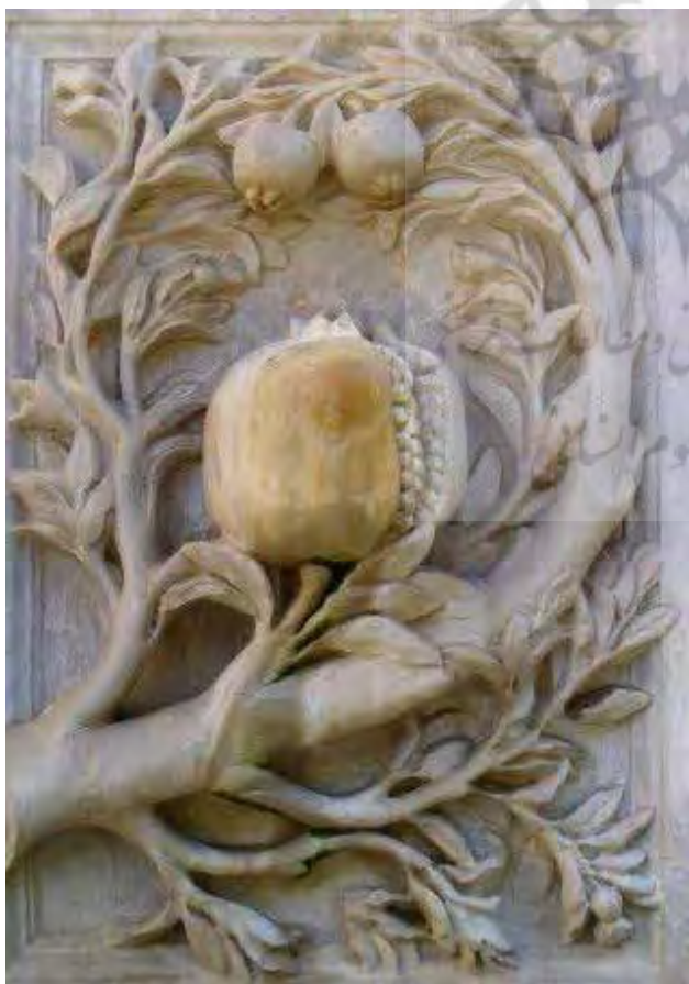
تصویر ۴. نقش انار در مجموعه الحمراء، گرانادا، اسپانیا.