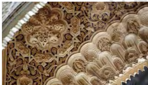
تصویر ۶. نقش اسلیمی (آرابسک) در کاخ الحمراء، گرانادا، اسپانیا. مأخذ: www.wikipedia.org .