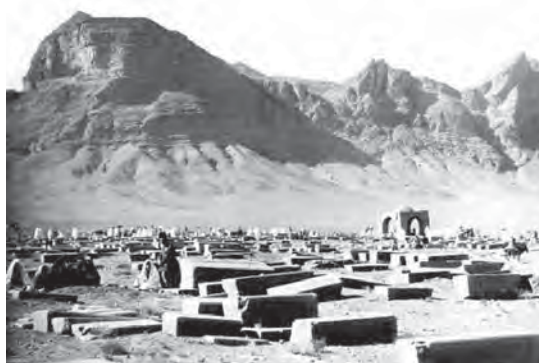
تصویر ۱. آرامگاه ارامنه جلفای اصفهان در دوره قاجار، ماخذ: هولتسر، ۱۳۸۲

قدیمی‌ترین سنگ مزار آن متعلق به تاریخ ۱۵۵۱ میلادی است. مزارها مدفن انبوه مسیحیان به ویژه ارامنه ایران و اروپاییان مسیحی و از تمامی اقشار جامعه است که از دوران صفوی تا به امروز در آنجا آرمیده‌اند (بلانت، ۱۳۸۳، ۱۰۴) (تصویر ۱ و ۲).