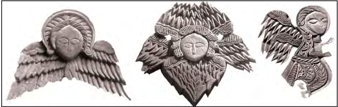
تصویر ۵. حجاری‌های کلیسای تادئوس مقدس، ماخذ: شاهمندی، ۱۳۹۲، ۱۰۱-تصویر ۶- فروهر- تخت جمشید، ماخذ: نگارنده

و فرشتگان در طول تاریخ بر پیامبران مانند حضرت ابراهیم، حضرت موسی، حضرت مریم، حضرت عیسی و حضرت محمد(ص) و برخی قدیسان ظاهر شده اند (شاهمندی، ۱۳۹۲، ۱۰۰-۹۹).