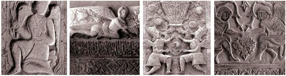
تصویر ۹. فرشتگان مزارهای تخت فولاد،