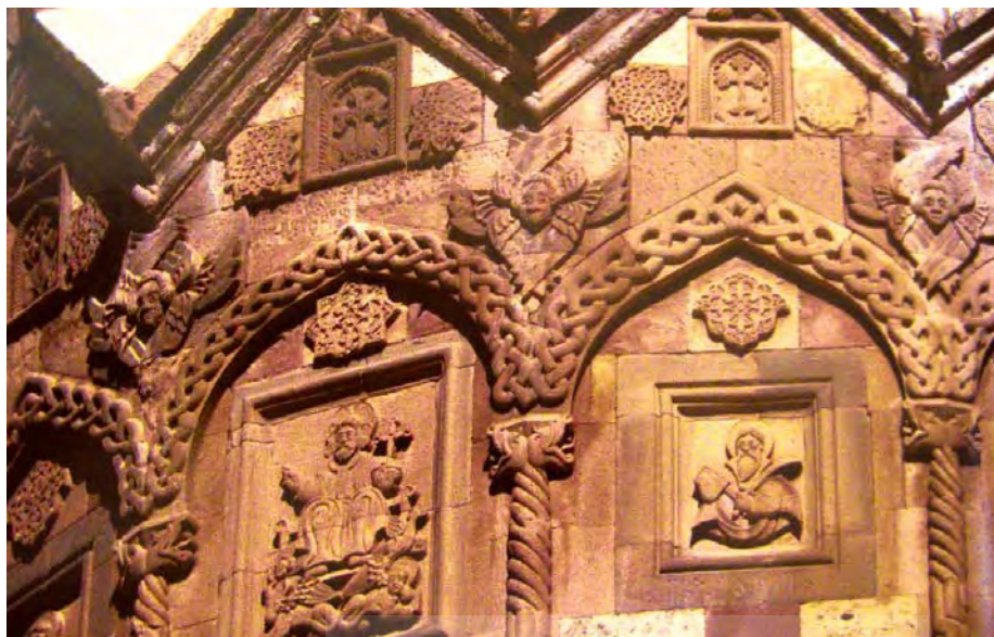
تصویر ۷. کلیسای استپانوس مقدس - جلفا