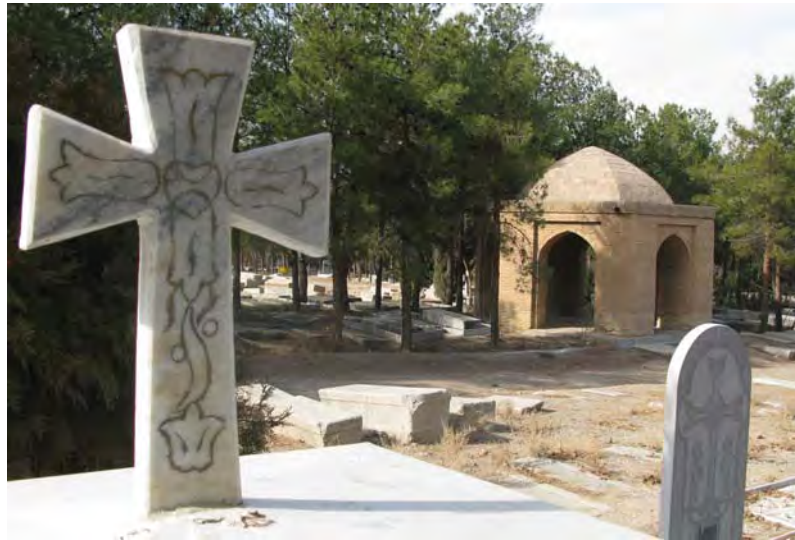
تصویر ۲. آرامگاه ارمنه جلفای اصفهان، پاییز ۱۳۹۵

است (جدول ۲). ۲- قاب بندی با فرم قوس تیزه دار قدیمی تر و تاحدودی وام دار میراث خاچکارهای قدیمی ارمنه و طرح محرابی اسلامی می باشد (جدول ۲).