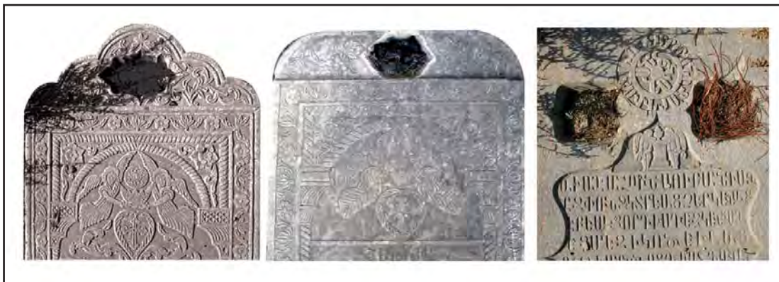
تصویر ۴. نمونه‌های تشت آب و نقش مایه فرشته در بالای برخی سنگ مزارهای ارامنه