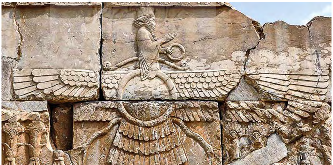
تصویر ۶- فروهر- تخت جمشید

در سنگ قبور آرامنه جلفا فرشتگان با دو بال و اکثرا با خطوط گردان و یا شکسته ترسیم شده‌اند، حال آن که در نقوش و تزیینات کلیسایی انواع فرشتگان با تعداد بال‌های مختلف موجود هستند که به فرشتگان چهاربال و شش بال به ترتیب کروب و سر و به می‌گویند (تصویر ۵). فرشتگان در بسیاری از مزارها به دور نماد مسیح و صلیب هستند که اولویت او را شهادت می‌دهند. اصلی‌ترین فرشتگان خداوند در تمامی ادیان توحیدی میکائیل، جبرئیل و اسرافیل می‌باشند. در آموزه‌های این ادیان همه انسان‌ها، فرشتگان نگهبان دارند که به ویژه برای ارواح پرهیزکاران دارای پیام خوش و بشارت هستند