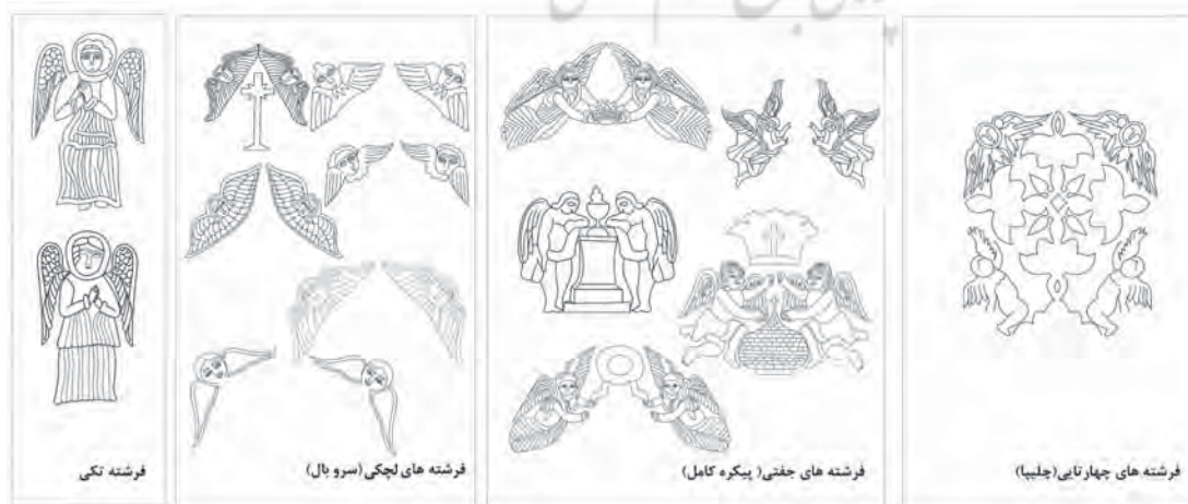
تصویر ۸. شکل انواع فرشتگان