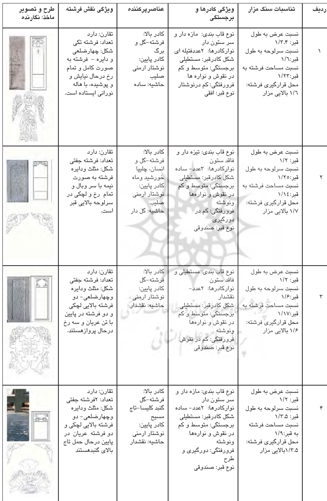
جدول ۲- بررسی سنگ مزارها- ماخذ: نگارندگان