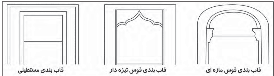
تصویر ۳. انواع قاب بندی های سنگ مزارها

تناسب میان طول کادر سرلوحه سنگ به طول سنگ قبر بین نسبت حدود (\frac{1}{4}) تا (\frac{1}{8}) هستند لوحه پایینی قبر به طول کل آن بین نسبت حدود (\frac{1}{18}) تا (\frac{1}{12}) می باشد و بیانگر این که کادر پایین بیشترین فضای سنگ را به خود اختصاص داده است (جدول ۲- تناسب کادرها).