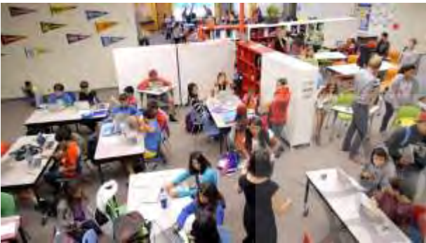
تصویر ۱۲ کلاس درس ترکیبی به روش منعطف (Summit Public Schools)

در آموزش ترکیبی به شیوه «منعطف»، اولویت با خودآموزی است و دانش‌آموزان در محیط یکپارچه مطالعه با برنامه پیشنهادی نرم‌افزاری به مطالعه درس‌ها می‌پردازد. در این شیوه، کلاس‌هایی در مجاورت فضای جمعی در نظر گرفته می‌شوند که به جنبه‌های دیگر آموزشی مانند بحث کلاسی، ارائه کلاسی، کار گروهی، کارهای هنری و کارگاهی، فعالیت‌های آزمایشگاهی و ... پرداخته می‌شود.