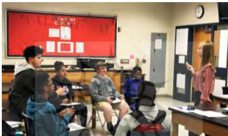
تصویر ۷- کلاسی با چیدمان مناسب برای شیوه بارش مغزی و جیگ‌ساو (Easton Area Middle School)

در روش «جیگ‌ساو» دانش‌آموزان در یک گروه کوچک به هم درس می‌دهند و بدین صورت بر مهارت‌های ارتباطی آنها و بالا رفتن میزان یادگیریشان اثر مثبتی دارد. روش «بارش مغزی» نیز در گروه‌های کوچک بهتر قابل اجراست و هر دانش‌آموز می‌تواند آزادانه نظرات خود را بیان کند. این روش از بهترین روش‌ها برای رشد خلاقیت در دانش‌آموزان است. کلاس‌های کوچک با چیدمان منعطف و قابل تغییر بهترین گزینه برای اجرای این دو شیوه هستند هرچند با تقسیم یک کلاس بزرگ در غالب چند گروه هم می‌توان این روش‌ها را اجرا کرد. داشتن یک تخته متحرک برای هر گروه می‌تواند به اجرای بهتر این روش‌ها کمک کند.