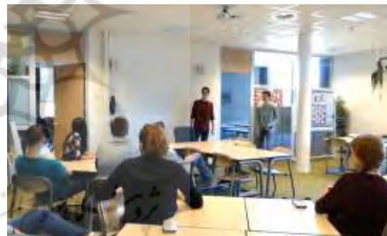
تصویر ۵ کلاسی با چیدمان مناسب برای آموزش مشارکتی (ISW Hoogeland)