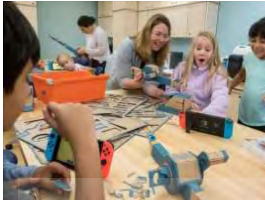
تصویر ۳ کلاسی با چیدمان مناسب برای شیوه حل مسئله

در روش‌های غیرمستقیم اولویت بر این است که دانش‌آموز خود بتواند دانش خود را با همکاری همکلاسان و مشورت معلمان شکل دهد. این روش‌ها دانش‌آموز را مسئول یادگیری خود قرار می‌دهند و چه برای دروس عملی-کارگاهی و چه دروس علمی-نظری قابل استفاده هستند. چیدمان مناسب کلاسی برای روش «حل مسئله»، کلاسی منعطف با دسترسی به انواع منابع آموزشی چاپی و آنلاین برای جستجوی دانش‌آموزان است. در این شیوه مسئله‌ای برای یک دانش‌آموز و یا یک گروه مطرح می‌شود و او سعی می‌کند با جستجو و امتحان کردن روش‌های مختلف به نتیجه برسد و معلم نقش راهنمای مسیر را بازی می‌کند. به ثمر نشستن این دو شیوه می‌تواند زمان‌بر و نیازمند حوصله زیادی باشد و لازم است چیدمان کلاسی منعطف و راحت باشد. با توجه به اینکه بعضی از دانش‌آموزان در سکوت و بعضی در هنگام صحبت در جمع، به راه‌حل می‌رسند، مناسب است کلاس‌های بزرگ، به دو بخش کار انفرادی و کار گروهی تقسیم شوند و حائلی همچون دیوار شیشه‌ای بینشان قرار گیرد.