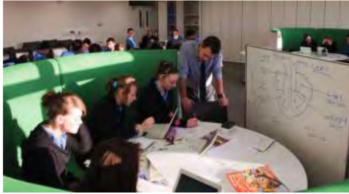
تصویر ۱۰ کلاس درس ترکیبی به روش چرخش بین ایستگاه‌ها (Chantry High School, Ipswich)

در آموزش ترکیبی به شیوه «منعطف»، اولویت با خودآموزی است و دانش‌آموزان در محیط یکپارچه مطالعه با برنامه پیشنهادی نرم‌افزاری به مطالعه درس‌ها می‌پردازد. در این شیوه، کلاس‌هایی در مجاورت فضای جمعی در نظر گرفته می‌شوند که به جنبه‌های دیگر آموزشی مانند بحث کلاسی، ارائه کلاسی، کار گروهی، کارهای هنری و کارگاهی، فعالیت‌های آزمایشگاهی و ... پرداخته می‌شود.