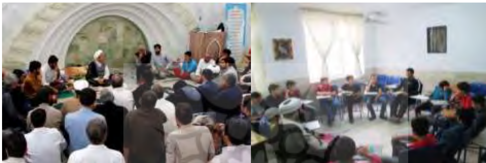
تصویر ۲ چیدمان فضای داخلی در روش حلقه