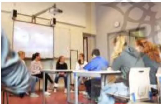
تصویر ۶ کلاسی با چیدمان مناسب ارائه کلاسی (ISW Hoogeland) (منبع: New School designs, 2012)

تصویر سمت چپ The Harkness Table, College Preparatory School, Oakland, California (منبع: New School designs, 2012)