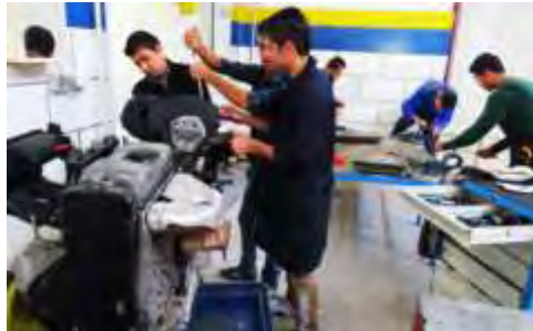
تصویر ۱ چیدمان فضای داخلی در روش استاد-شاگردی

حلقه انس، معرفت، مطالعه، شعر، پژوهش، فیلم و تدبیر در قرآن (میرمحمدیان، ۱۳۹۵). حلقه انس یک حلقه خودمانی است که افراد در فضایی صمیمی با یکدیگر درباره موضوعات مختلف صحبت می‌کنند. هدف از آن ایجاد فضای صمیمی به منظور مشخص شدن برخی ایرادهای رفتاری دانش‌آموزان است. کسب مهارت‌هایی چون ابراز نظر و تحمل مخالف از دیگر اهداف حلقه انس به شمار می‌رود (میرمحمدیان، ۱۳۹۵). حلقه مطالعه با دو هدف طراحی می‌شود یکی بالا بردن مهارت مطالعه و دیگری بالا بردن دانش کسانی که در حلقه شرکت می‌کنند. در حلقه پژوهش مهارت‌هایی همچون جمع‌آوری منابع، تعریف منابع، انتخاب موضوع، چرک‌نویس، پاک‌نویس و نحوه ارائه آموزش داده می‌شود؛ هدف باطنی حلقه پژوهش، یادگیری برخی موضوعات به بهانه پژوهش است. در حلقه فیلم بیان جنبه‌های محتوایی مثبت و منفی و درس‌های عبرت‌آموز فیلم‌ها انجام می‌گیرد (میرمحمدیان، ۱۳۹۵).