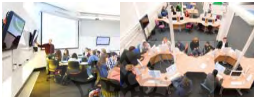
تصویر ۸ میز کار و امکانات سخت‌افزاری مناسب برای کلاس درس ترکیبی

وجود تجهیزات سخت‌افزاری مناسب همچون دستگاه‌های کامپیوتر، لپ‌تاپ و تبلت، امکانات شارژ مناسب و میزها و صندلی‌های ارگونومیک برای اجرای موفق آموزش ترکیبی الزامی است. طراحی مناسب میز کار و قفسه‌های نگهدارنده لوازم الکترونیکی و ایستگاه‌های شارژ می‌تواند نظم کلاسی در آموزش ترکیبی را تضمین کند.