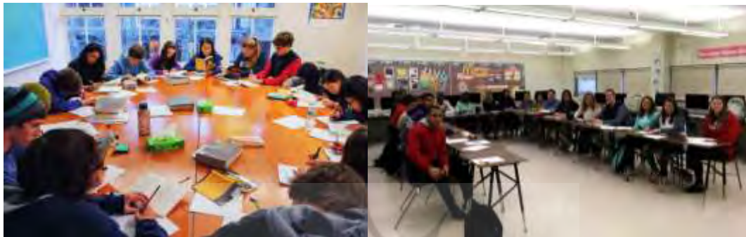
تصویر ۴ کلاسی با چیدمان مناسب برای بحث کلاسی تصویر سمت راست Easton Area Middle School

«ارائه کلاسی» از بهترین روش‌های آموزشی برای یادگیری مشارکتی است. اگر کلاس بتواند فضای مناسبی برای آماده‌سازی تکلیف گروهی باشد و امکان ارائه مناسب را به دانش‌آموزان بدهد؛ این شیوه می‌تواند به آموزش تعامل با افراد و مسئولیت‌پذیری در گروه کمک کند. چیدمان کلاسی باید روبرو به صفحه نمایش باشد و اعضای گروه ارائه‌دهنده بتوانند روبروی کلاس بنشینند و در کنار هم موضوع را برای هم‌کلاسی‌ها ارائه دهند. مناسب بودن سیستم سمعی-بصری و آکوستیک کلاس می‌تواند به اجرای بهتر این شیوه کمک کند.