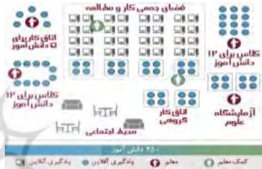
تصویر ۱۱ چیدمان مناسب کلاس درس ترکیبی به روش منعطف (New Teacher Center, 2017)