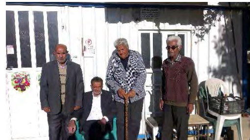
تصویر ۳- عدم وجود فضای نشستن در اطراف میدان