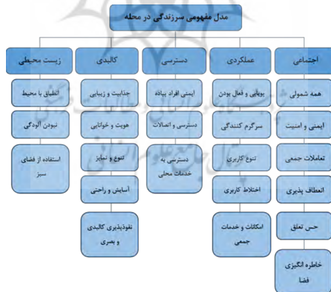
نمودار ۳- مدل مفهومی سرزندگی در محله (ماخذ نگارنده)

با توجه به آنچه بیان شد، حاکی از آن است که وجود انسان در فضا به عنوان معیار اصلی در بهبود کیفیت فضاهای شهری موثر است و نکته قابل توجه در رابطه با این موضوع آفرینش کیفیت‌هایی است که حضور فرد در محیط را تسهیل و به تناسب آن ترغیب نماید. سرزندگی به مفهوم تنوع فعالیت‌ها و استمرار جریان زندگی در محله و ایجاد حس تعلق و تناسب انسانی در کالبد محله و مرکز محله، به این نتیجه می‌رسیم که علاوه بر در نظر گرفتن مسائل کمی، باید بر مسائل کیفی طراحی اهمیت قائل شده و در عین حفظ شروط مکانی سرزنده اعم از پیاده مدار بودن و حضور عناصر شاخص، و در نظر گرفتن عوامل کالبدی به بهترین شکل، فضایی عمومی و همگانی در مجموعه به منظور تقویت تعاملات و مشارکت ساکنین در نظر گرفته شود و حضور و مشارکت افراد که شرط تحقق سرزندگی است با ایجاد امنیت به حد اعلا خود رساند و در این میان تامین شرایط مناسب زیستی و کاهش آلودگی‌های محیطی بسیار حائز اهمیت است. ترکیب همه عوامل اجتماعی، اقتصادی، فرهنگی، روانشناختی و زیباشناسی به گونه‌ای که با عوامل محیطی و بستر مکان در یک راستا قرار گیرد؛ می‌تواند مجموعه‌ای با نشاط بوجود آورد که این نشاط به گفته سقراط دلیل بر خوشبختی افراد و در نهایت سرزندگی آن‌ها خواهد بود. مدل مفهومی سرزندگی در محله در نمودار شماره ۳ نشان داده شده است.