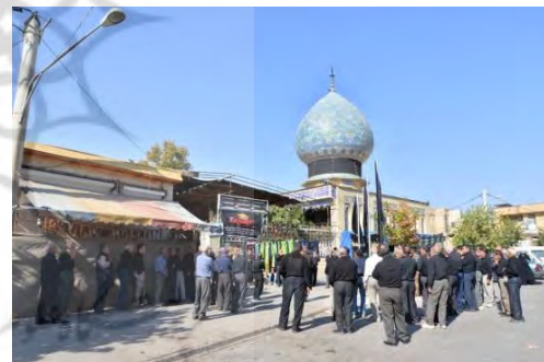
تصویر ۱- مراسم عاشورا ۱۳۹۷