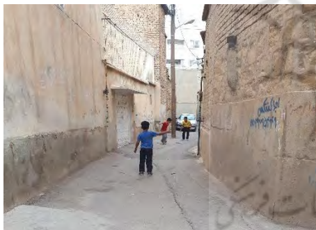
تصویر ۲- کوچه های کم عرض

بیشترین عاملی که به عقیده ساکنین در محله مشاهده می‌شود، مشارکت اهالی محله در رویدادهای محله است، امنیت محله نیز مورد دیگری بود توسط همه مصاحبه شوندگان به آن اشاره شد. کمبود پارک و فضای سبز عاملی بود که اهالی محله علی‌الخصوص جوانان به آن اشاره کردند. بیشتر مصاحبه شوندگان از خوانایی محله و خدمات ارائه شده و وجود حسینیه و شاهزاده محمد (برگزاری مراسم عاشورای سال ۹۷ در تصویر ۱ در مجاورت حسینیه) و همچنین مساجد متعدد احساس رضایت داشتند. بافت قدیم و فرسوده و نیز معابر و کوچه‌های کم عرض (تصویر ۲)، که پاسخگوی مناسبی برای ارائه خدمات نیست گلابه داشتند. وجود زباله در کوچه‌ها و همچنین متروکه شدن برخی از خانه‌ها و زمین‌ها که منجر به جمع شدن زباله در آن‌ها شده است، سبب نارضایتی عده‌ای اهالی شده است. کمبود مکان‌های فرهنگی و ورزشی که بیشتر جوانان و نوجوانان به آن اشاره کردند. با این وجود بیشتر افراد قدیمی و مسن ساکن در محله احساس رضایت و آرامش و آسایش زیاد نسبت به این مکان داشتند. عوامل ذکر شده بر اساس فراوانی اشاره به آن در نمودار ۲ نمایش داده شده است.