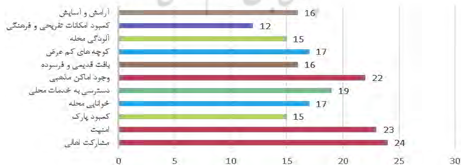
نمودار ۲ - بررسی میزان نقاط قوت و ضعف از دیدگاه ساکنین ( ماخذ: نگارنده)

بخش دوم مصاحبه؛ با توجه به هر کدام از معیارها، سوال‌ها در غالب گفت‌وگوی صمیمانه با ساکنین محله در میان گذاشته شد. در بررسی معیار اجتماعی امنیت، تعامل و مشارکت بین اهالی، حس تعلق به محله خصوصا در میان افراد مسن بالاترین میزان اهمیت از نگاه ساکنین داشتند. اقامت طولانی مدت، خاطرات مشترک، زندگی در کنار آشنایان، شناخت اهالی از هم، برگزاری مراسم مذهبی و آیینی و وجود اماکن مذهبی از دلایل افراد برای اثبات این موارد بود.