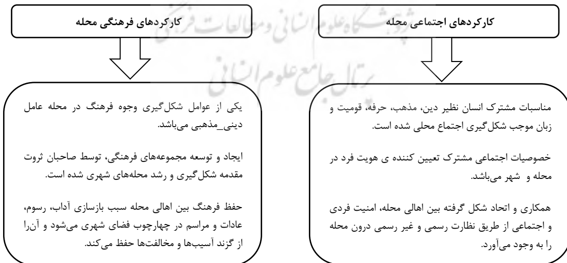
نمودار ۱- کارکردهای محلّه

محلّه به عنوان سکونت گاهی اجتماعی محل استقرار شهرنشینان بوده است. این واحد اجتماعی که رکن جامعه ایرانی محسوب می شد، ساختار کالبدی شهرهای ایران باستان را در قالبی متفاوت در ایران اسلامی به نمایش گذاشت. عوامل متعدد سیاسی اداری، اقتصادی و اجتماعی - فرهنگی موجب شکل گیری فضای کالبدی محلّه در شهر شده که از این میان، عوامل اجتماعی و فرهنگی به واسطه ارتباط مستقیم با خصایص اجتماعی و خصلت فرهنگ پروری محلّه از اهمیت خاصی برخوردارند (بحری مقدم و یوسفی فر، ۱۳۹۲: ۱۰۱). عدم توجه به ویژگی های خاص مکانی و فرهنگی و ارزش های بومی و محلی در فرآیندهای توسعه شهری منجر به یکنواختی سیما و ظاهر شهرها شده است و محلات شهری به عنوان مکان تبلور فرهنگ جایگاه و هویت خود را از دست داده و همچنین جذابیت های ناشی از تمایزات مکانی و فرهنگی در این راستا کم رنگ شده است (همان: ۱۰۳). نمودار ۱ کارکردهای اجتماعی و فرهنگی محلّه محلات را بیان می کند.