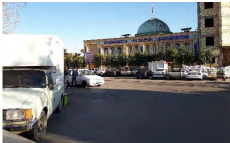
تصویر ۴- پارک کردن ماشین‌ها در میدان

در میان شاخص‌های معیار دسترسی و اتصالات بیشترین عامل موثر دسترسی به خدمات جمعی است، طبق گفته ساکنین همه نیازهای روزانه و هفتگی ساکنین به راحتی محیا می‌شود و نیازی به مراجعه خارج از محله ندارند. در این میان فقدان فضایی جهت نشستن و گذران اوقات افراد محلی به شدت احساس می‌شود (تصویر ۳). وضعیت عابر پیاده نیز از وضعیت مناسبی برخوردار نیست و نیز کوچه‌های تنگ جهت تردد استفاده همزمان پیاده و سواره امکان پذیر نمی‌باشد و بعضاً در بسیاری از معابر بافت قدیم امکان تردد اتومبیل نیز وجود ندارد. تصویر ۴ وضعیت نامناسب پارک خودروها در میدان را نشان می‌دهد. از میان شاخص‌های کالبدی، ساکنین معتقد بودند با وجود از بین رفتن خانه‌های تاریخی و قدیمی و نیز ساخت و سازهای جدید، اما حضور امامزاده و مسجد جامع و نیز باغ‌های قصرالدشت، همچنان باعث حفظ هویت و خوانایی محله شده است.