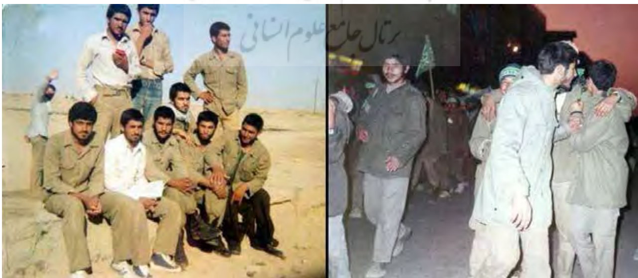
تصویر ۸. نور موجود در عکس.