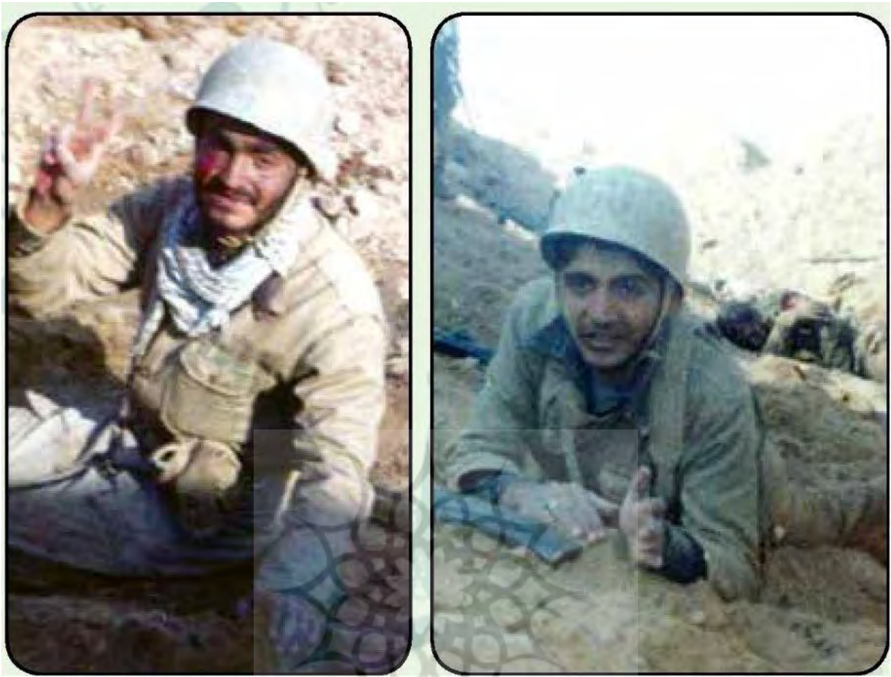
تصویر ۱۱. اشکالات تکنیکی عکس‌ها.