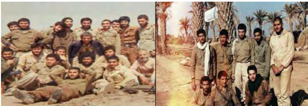
تصویر ۷. شیوه ایستادن و نشستن رزمندگان.