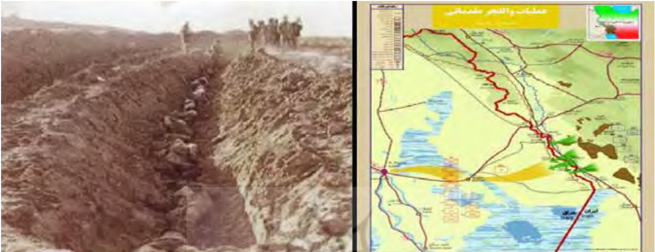
تصویر ۴. محدوده جغرافیایی عملیات والفجر مقدماتی.

- نور موجود در عکس: در مجموعه تصاویر عملیات والفجر مقدماتی، رنگ نوری عکس‌هایی که در کوهستان عکاسی شده با عکس‌های دشت تفاوت دارد. عکس‌های کوهستان تنالیت‌های تیره دارد و عکس‌های دشت تنالیت‌های روشن (تصویر ۸ و جدول ۶). - پیش‌زمینه و پس‌زمینه عکس‌ها: در پس‌زمینه و پیش‌زمینه