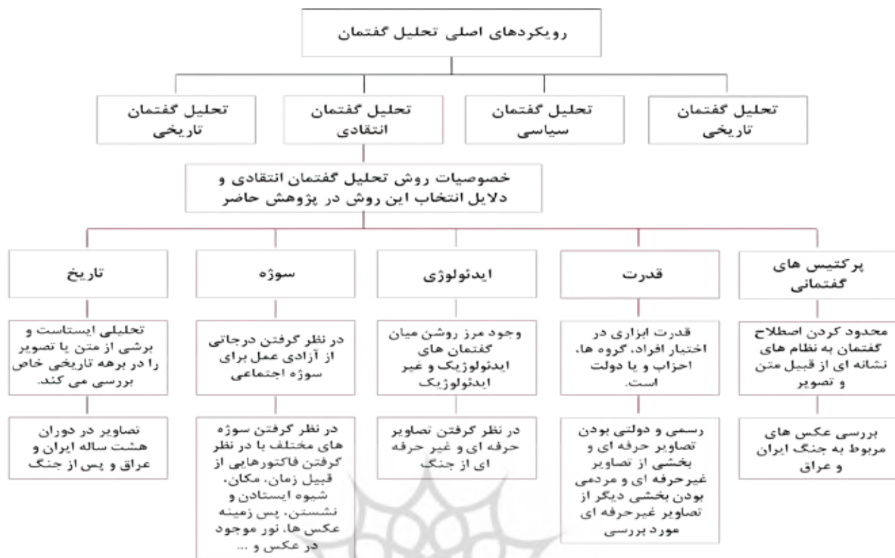
تصویر ۱. رویکردهای اصلی تحلیل گفتمان و ویژگی های تحلیل گفتمان انتقادی.

مورد فکه نگاه رسمی، عملیات والفجر مقدماتی را شکستی بزرگ به حساب آورد تا جایی که نام گذاری این عملیات پس از شکست، به عنوان «مقدماتی» تأییدکننده این موضوع است. این در حالی است که در روایت مردمی، عملیات والفجر مقدماتی یک پیروزی است و تجلی هویت مسلمان شیعه در تاریخ معاصر است. کانال کمیل به سبب شهادت مظلومانه بسیاری از رزمندگان، ظهر عاشورا پذیرای عده زیادی از مردم شهرهای دور و نزدیک برای برگزاری مراسم ظهر عاشورا است. موقعیت افراد محاصره شده در کانال، سختی ها و مقاومت های روایت شده از رزمندگان باقی مانده گردان های «کمیل» و «حنظله» باعث شده که مردم رزمندگان این کانال را شبیه به سپاهیان امام حسین (ع) در روز عاشورا بدانند (گروه فرهنگی شهید ابراهیم هادی، ۱۳۹۱، ۱). در واقع وقتی رزمندگان در میان دو تپه منطقه عملیاتی فکه محاصره شدند بعد از سه روز مقاومت با لب تشنه قتل عام شدند، بنابراین این منطقه به «قتلگاه عاشورا» معروف شده است. حتی بعد از سقوط فکه و وقتی پاسگاه های منطقه سقوط کردند، نیروهای مستقر هنگام عقب نشینی راه را گم کرده و به دلیل تشنگی به شهادت رسیدند (ربیعی و تمنایی، ۱۳۹۲، ۱۰). • عکس جنگ به مثابه متن علیرضا کمری می گوید: «سرشت زبان فارسی ادبی است ... وقتی کسی می گوید (داستان آن مرد...)، از سطح آهنگ کلام تا خود کلمه ها و جمله ها و عبارات کاملاً ادبی یا تصویرسازی ادبی هستند- بی آنکه شخص آن را اراده کرده باشد» (کمری،