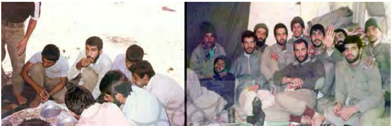
تصویر ۶. سادگی وسایل، البسه و به صورت کلی رزمندگان در عکس.