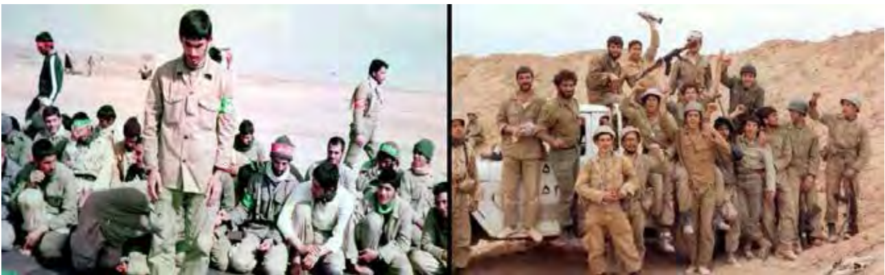
تصویر ۵. تنوع در لباس‌های رزمندگان به واسطه وابستگی نظامی آن‌ها.