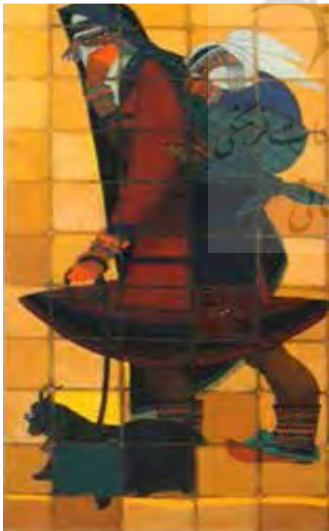
تصویر ۳. جلیل ضیاءپور، ۱۳۳۲. «زن کرد قوچانی»

می‌شود که نقاش در پی نمایش چیزهای دیگری جز صور می‌گردد، و می‌نماید که صور طبیعی برای نمایش نفسانیات او بهانهٔ ضعیف و نارسایی بیش نیستند ... هنرمندان روی علل طبیعی و نیازمندی، تغییراتی را استنباط کردند و پا در دایره سلیقه گذاشتند و به شدت هرچه تمام‌تر در سعی این بودند که نقاشی‌های تصویری را به مرحله نقاشی‌های تزئینی برسانند و از اختلاط آن دو بر زیبای منظور خود بیفزایند. همچنین ضیاءپور حرکت از نگره تصویری به نگره تزئینی با توسل به کوبیسم را پله اول برای قرارگرفتن در مسیری می‌دانست که در آن با مشق شیوه‌های کوبیستی، نقاشی نوگرای ایران راه خود را پیدا خواهد کرد (دل زنده، ۱۳۹۶، ۲۹۶). شیوه ملی و اختصاصی در سیرتاریخی آثار ضیاءپور نقطه‌ایست که وی گرایش صرفاً کوبیستی آثاری چون مسجد سپهسالار (تصویر ۲) را کنار گذاشته و با پیش‌گرفتن رویکردی نظری به دستاوردهای شخصی‌تری نائل شده است. شیوه ملی و اختصاصی ضیاءپور را می‌توان کوششی در راه رسیدن به واقع‌گرایی مفهومی رایج در نظریه کوبیسم دانست. این دست آثار ضیاءپور (تصاویر ۳ تا ۵) تلاش‌هایی بر بنیان‌های نظری کوبیسم هستند، آنجا که پوسته ظاهر شکافته و به درون نگرسته می‌شود و به موازات فرم، محتوا نیز وارد اثر می‌شود. محتوای قابل خوانش آثار شیوه ملی و اختصاصی ضیاءپور در این تطبیق با شهرسازی افق تازه‌ای به خود می‌گیرد. با این تفاسیر شیوه ملی و اختصاصی ضیاءپور را می‌توان گونه‌ای از کوبیسم مبتنی بر نظریه قلمداد کرد که با ایجاد دولا به پیش‌زمینه و پس‌زمینه، عدم بازنمایی تصویری، خلق فرم‌های نو و محتوای قابل خوانش صدای جدیدی را برای مخاطبینی جدید عرضه می‌کنند.