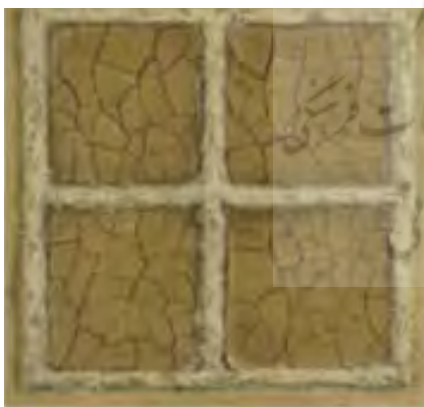
تصویر ۸. مارکو گریگوریان. ۱۳۴۴. «earth work».

مصالح بوم‌آورد ایرانی و کاهگل تشکیل شده‌اند. با توجه به اظهارات هنرمند و در تطبیق با هندسه شطرنجی رایج در شهرسازی، این پیش‌زمینه‌های شطرنجی افق معنایی تازه‌ای به خود می‌گیرند. بافت شطرنجی‌ای که بدون در نظر گرفتن زیرساخت‌های شهرسازی، اجتماعی و فرهنگی در حال شکل‌گیری است.