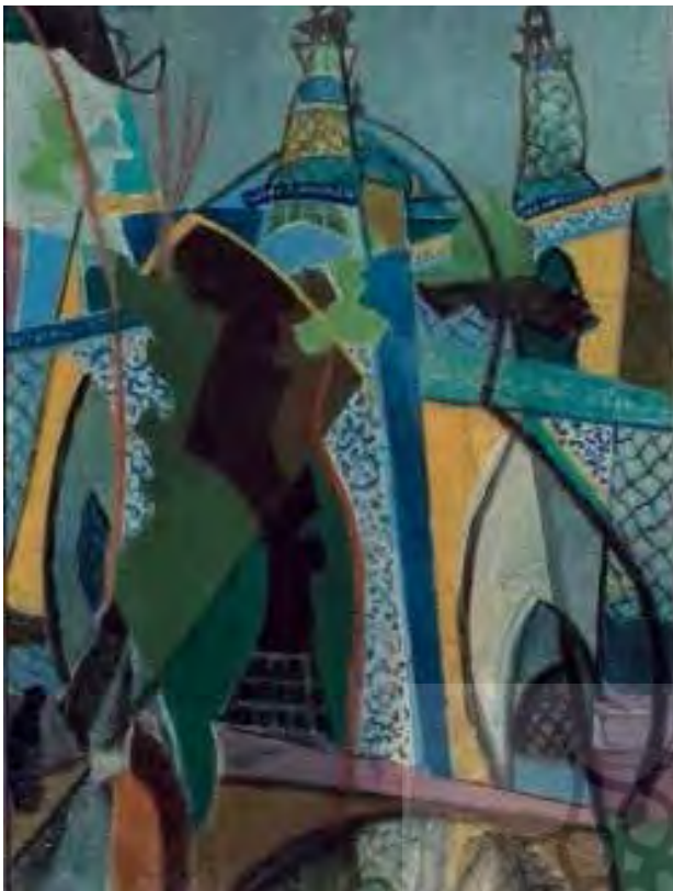
تصویر ۲. جلیل ضیاءپور، مسجد سپهسالار - گرایش کوبیستی جلیل ضیاءپور