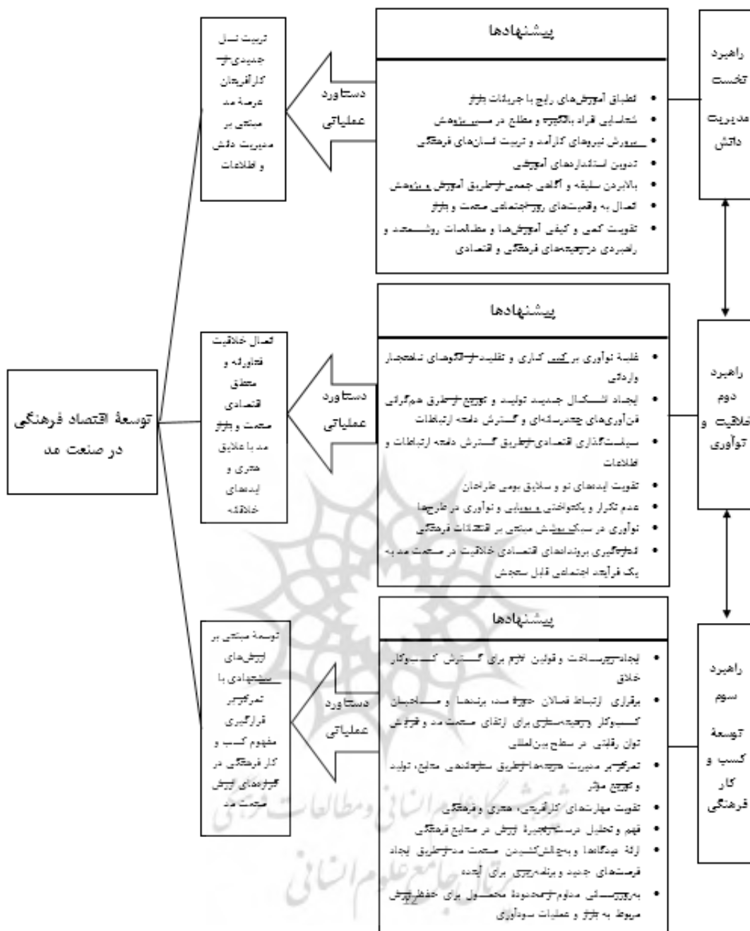
تصویر ۲. کاربست یافته‌ها: ایجاد یک مدل برای برکشیدن اقتصاد خلاق در صنعت مد ایران. مأخذ: نگارندگان.