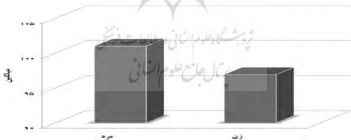
شکل (۲): میانگین هوش هیجانی در ورزشکاران زن و مرد

شکل ۲ میانگین هوش هیجانی در ورزشکاران زن و مرد برآورد شده است. مشاهده می شود ورزشکاران مرد دارای میانگین بالاتری از هوش هیجانی نسبت به ورزشکاران زن می باشند.