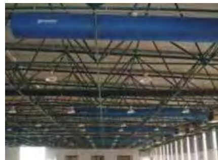
سقف غیر کاذب