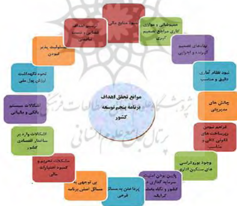
شکل ۲- موانع تحقق اهداف برنامه پنجم توسعه ایران

در برنامه پنجم توسعه برخلاف اعداد گزارش شده هیچ اقدامی در جهت افزایش سهم تعاونی‌ها در برنامه‌ریزی بلندمدت و بودجه سالانه صورت نگرفت و با آن وضع نتوانستند به اهداف مورد نظر دست یابند. با توجه به آن که اقتصاد مقاومتی به‌معنای حضور مردم در اقتصاد است و بهترین و والاترین اقتصاد مردمی، تعاونی است، برای پررنگ شدن