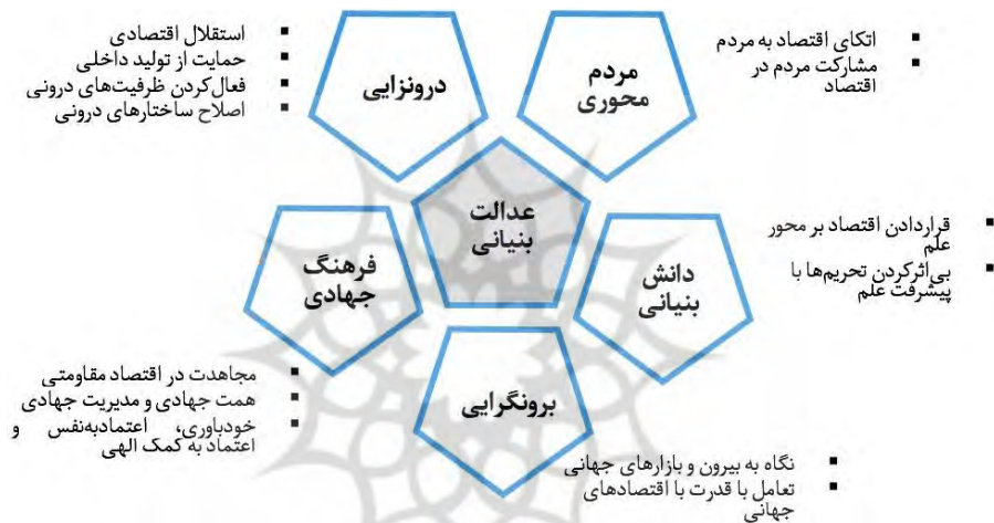
شکل (۲): مؤلفه‌های اقتصاد مقاومتی مبتنی بر عدالت

جهت اول، الهام‌گیری از نظام اقتصادی اسلام، جهت دوم راهبردی بودن و تأثیرگذاری بر شرایط فعلی اقتصاد کشور، جهت سوم منشأ فرهنگی و انقلابی و جهت چهارم، عدالت‌بنیانی و مردم‌محوری. با تحلیل بندهای ۲۴ گانه سیاست‌های ابلاغی اقتصاد مقاومتی و نیز بیانات رهبر انقلاب اسلامی در تبیین و تفسیر این سیاست‌ها با استفاده از روش‌شناسی داده‌بنیان، مؤلفه‌های اقتصاد مقاومتی با مبنای قرارداد عدالت، در قالب مدل مفهومی ذیل قابل ترسیم است: