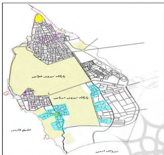
شکل ۱- نقشه شهر بوشهر

می‌شوند، شبکه‌های ارتباطی با عرض‌های پر پیچ و خم در حال شکل‌گیری‌اند، ساخت‌وسازها عمدتاً خارج از ضوابط صورت می‌گیرد و استفاده غیرمجاز از شبکه آب و برق رایج است (وزارت راه و شهرسازی استان بوشهر، ۱۳۸۶).