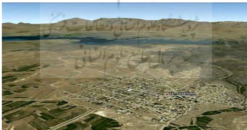
شکل ۳-۱: تصویر هوایی روستای یانچشمه

یانچشمه روستایی است در شهرستان بن استان چهارمحال و بختیاری که البته قبلاً بخشی از شهرستان چادگان و استان اصفهان بوده است. در سال ۱۳۹۱ شمسی با تصویب هیئت دولت روستای یانچشمه به‌عنوان مرکز بخش شیدا تصویب گردید. این مصوبه با توجه به مصوبه دولت در خصوص ارتقاء بخش بن به شهرستان صورت گرفت. این روستا در کنار زاینده‌رود و دریاچه پشت سد زاینده رود قرار گرفته است به همین جهت موقعیت مناسبی برای گردشگری و پذیرش توریست در تابستان‌ها دارد. مردم این شهر به لهجه مختص خویش از گویش‌های جنوب غرب از ترکی اوغوز سخن گفته و شیعه دوازده‌امامی می‌باشند (بانک اطلاعاتی روستاهای ایران، ۱۳۹۱: ۳).