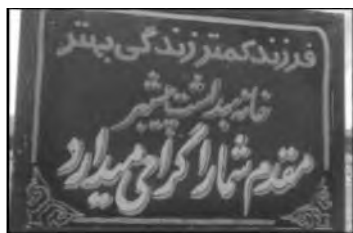
(تصویر شماره ۲): تابلوی ورودی شهر پیشبر

مددکاری سیار در روستاها و شهرهای کوچکتر و تأسیس کلینیک‌ها و تأمین مایحتاج درمانگاه‌ها و مطب‌های پزشکان در خصوص آموزش و جلوگیری از باروری نیز به نوبه خود در این مسیر حرکت می‌نمود. از جمله سیاست‌های دیگر می‌توان به اعطای ۵۰ هزار ریال، به عنوان پاداش به خانواده‌های زیر پوشش کمیته امداد امام خمینی دارای قدرت باروری در صورت توبکتومی یا وازکتومی اشاره نمود. همچنین در اولویت قراردادن این افراد در واگذاری مسکن، وام و هزینه‌های درمان، از سوی دیگر درخواست از روحانیون و کارشناسان بهداشت و درمان و رسانه‌های گروهی جهت ترغیب تنظیم خانواده و التزام به سیاست دولت جمهوری اسلامی ایران، از جمله این سیاست‌های تعدیلی بود (روزنامه خراسان، ۱۳۷۲). دیوار نوشته‌ها، شعارها بر روی بسته‌بندی‌های کالاها و اقلام مصرفی، تابلوهای عمومی در جاهای پرتردد و پربازدید شهرها، از جمله موارد دیگری بودند که در این سیاست سهم به‌سزایی داشتند. در تصاویر شماره ۱ تا ۴ می‌توان چند نمونه از این مثال‌ها را مشاهده کرد.