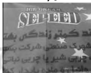
(تصویر شماره ۳): بسته بندی محصولات لبنی سپید

در جدول زیر میزان رشد جمعیت و میزان باروری از سال ۱۳۵۵ تا سال ۱۳۷۵ را نمایش می‌دهد. این جدول حاکی از آن است که میزان رشد جمعیت قبل و بعد از سیاست کنترل موالید دارای نوسان بوده و نقش تبلیغات را در آن نمودار می‌سازد.