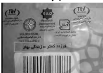
(تصویر شماره ۴): بسته بندی کالا