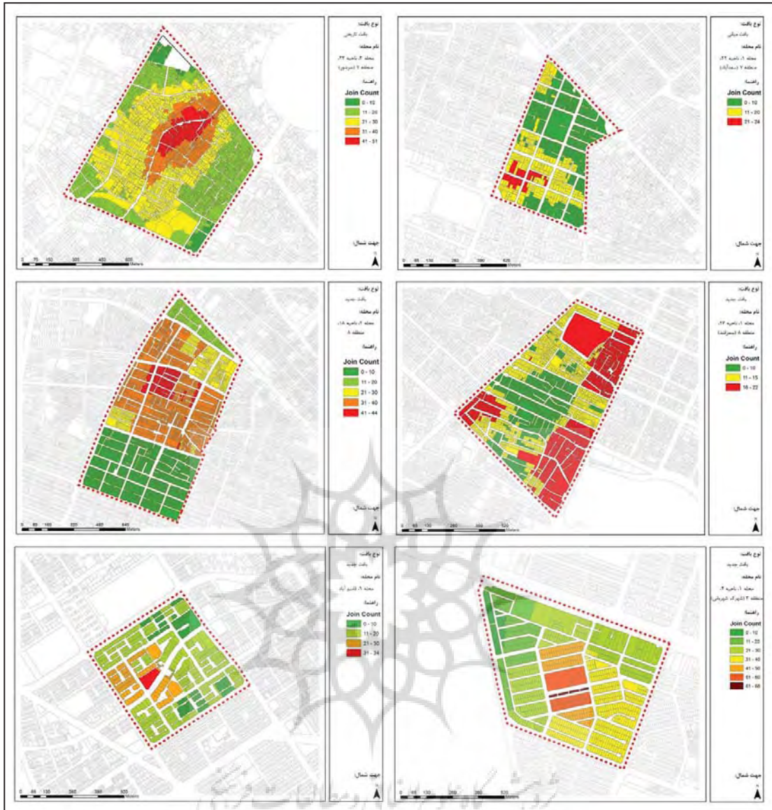
Fig. 2 Specifying common area among respondents in 6 neighborhoods in 10% classifications of common area among respondents

صورت زیر مطرح شد که بین میانگین مساحت قلمرو محله ادراک شده توسط ساکنین تفاوت معنی داری وجود ندارد. بررسی این موضوع در سطح خطای ۵ درصد مورد آزمون قرار گرفت. به این ترتیب فرضیه H_1 به صورت زیر مطرح شد: بین میانگین مساحت قلمرو محله ادراک شده توسط ساکنین در ۶ محله تفاوت معنی داری وجود دارد. نتایج آزمون نشان میدهد میانگین مساحت نقشه شناختی ساکنین از قلمرو محله بین بافتهای قدیم، میانی و جدید تفاوت معنی داری وجود دارد. (جدول شماره ۵) بیشترین میزان مساحت قلمرو محله ادراک شده در محله شهرک شهربانی است و کمترین آن در محله سعدآباد است.