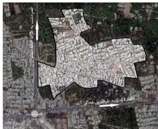
شکل ۱. محدوده مورد مطالعه.

از ۲۶ گویه پرسش‌نامه، ۲۵ گویه به صورت پنج گزینه‌ای (طیف لیکرت) مطرح شده که ۱۷ گویه آن با جواب‌های خیلی زیاد، زیاد، متوسط، کم و خیلی کم همراه بوده و ۸ سؤال با توجه به شناسایی عناصر محله و ادبیات موضوع در همان طیف کیرت با مطرح کردن موارد مورد نظر پژوهش