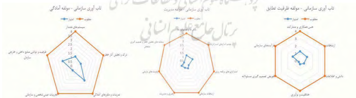
شکل ۳. میزان تاب‌آوری سازمانی در ابعاد مختلف

بررسی تاب‌آوری سازمانی از منظر ابعاد تشکیل دهنده این مؤلفه نیز قابل تأمل است براساس یافته‌های حاصله که به طور کلی در نمودار زیر میزان تاب‌آوری سازمان مورد مطالعه در مقابله با بحران به تفکیک مؤلفه‌ها و شاخص‌ها در شکل ۳ مشاهده می‌گردد.