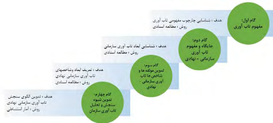
شکل ۱: روش‌شناسی پژوهش جهت سنجش تاب‌آوری سازمانی - نهادی

ظرفیت تطابق؛ توانایی سیستم در تطابق در واقع خصیصه اصلی سازمان در تاب‌آوری لحاظ می‌شود. کاندرا و واچتندروف ۲ در سال ۲۰۰۳ در خصوص ظرفیت تطابق بدین صورت ابراز داشته است که رفتار تطابقی سازمان در واقع فقط بر تسهیلات کالبدی و مادی سازمان متکی نیست و در واقع تمرکز بر روی فرهنگ و قابلیت‌های کارمندان تأکید دارد (Kendra and Wachtendorf, 2003).