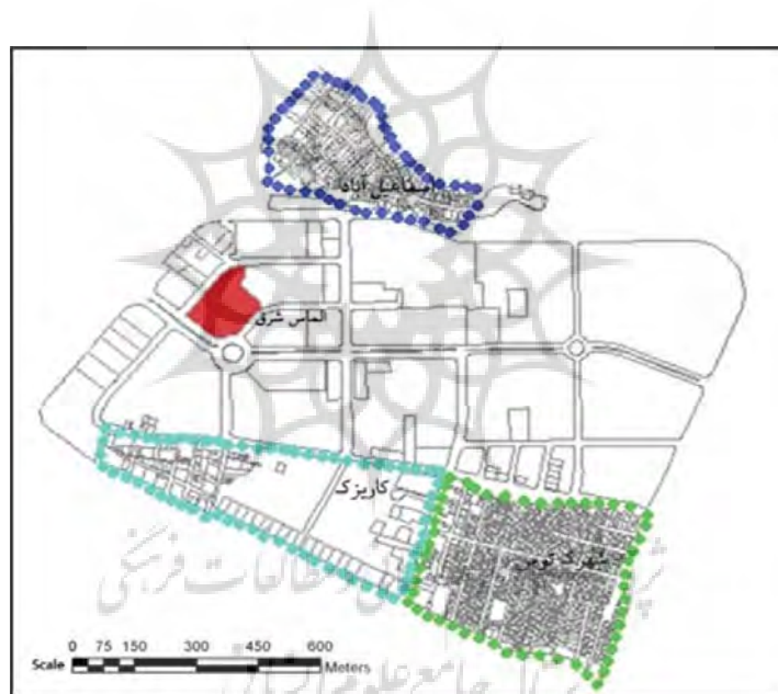
شکل ۲- نقشه موقعیت ابرپروژه نقشه موقعیت ابرپروژه الماس شرق و محلات پیرامونی

تعلق، عدالت اجتماعی، اقتصاد خانوار، اقتصاد مکان و شرایط محیط زیست شده طی پرسشنامه‌ای بر مبنای نظر مردم محلات مورد مطالعه مورد سنجش قرار گرفت. برای کمی‌سازی معیارهای پرسشنامه از مقیاس فاصله‌ای استفاده گردید که در جدول شماره ۱ نشان داده شده‌اند: