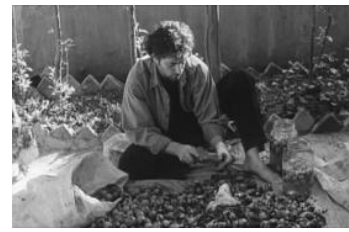
تصویر ۴. عدم تداخل در رفع نیازهای گروه‌های سنی و جنسیت‌های مختلف در حیاط خانه ایرانی