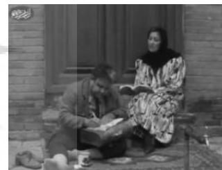
تصویر ۳. پاسخدهی به انواع فعالیت‌های اجتماعی عاملی برای حضور دسته جمعی افراد

در این خانه‌ها را فراهم آمده است. چهار نسل متفاوت با نیازها و فعالیت‌های گوناگون مستقر در خانه، حیاط را قرارگاهی برای رفع نیازهای خود یافته‌اند. مک‌اندرو این وضعیت را با عنوان حس جمعی بیان کرده و می‌نویسد: احساس تعلق داشتن به یک جمع، این احساس که همسایگان برای یکدیگر مهم هستند و برآورده شدن نیازهای آنها در گروه تعهد جمعی است (مک‌اندرو، ۱۳۸۷: ۳۳۲). مرد جوان که مشغول به کار خانگی است در کنار بازی پسر همسایه هیچ محدودیتی برای انجام فعالیت‌های دیگر خانوارها از جمله افراد مسن ایجاد نکرده است، همین عدم محدودیت با رعایت حریم برای بانوان نیز میسر شده است (تصویر ۴).