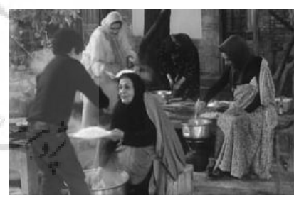
تصویر ۵. تامین نیاز به ارتباط با همسایه، کار دسته جمعی و اعتقادات مذهبی به عنوان بخشی از فرهنگ ایرانیان از طریق حیاط خانه‌ها