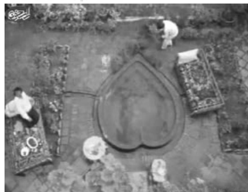
تصویر ۲. معماری انسان- محور حیاط خانه ایرانی در مقابل معماری بصر- محور نوگرا