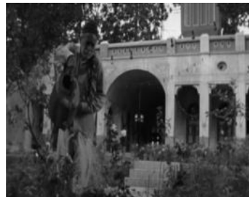
تصویر ۱. ارتباط دوسویه انسان و طبیعت، و قابلیت‌های نهفته محیط، بواسطه حضور مصالح طبیعی در حیاط خانه ایرانی

مکان‌گرایی ۴ در حیاط این خانه موجب بروز رفتارهایی از راه‌های همسان شده است.