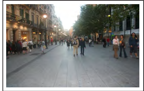
شکل ۲. احداث محورهای پیاده شهری از جمله مهمترین سیاستها و راهکارهای بهسازی بافت قدیم شهری (محوری پیاده در بارسلون)