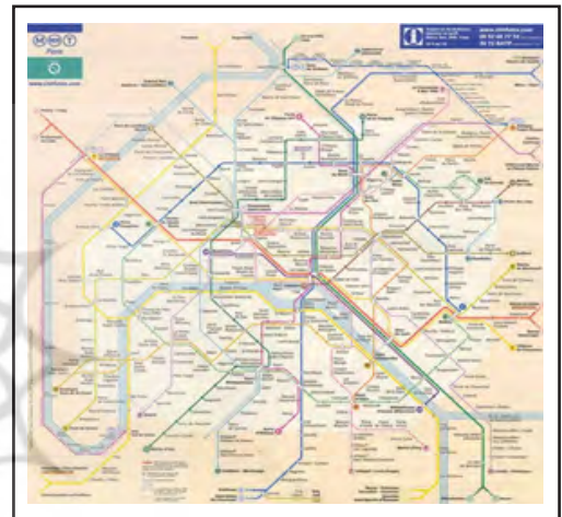
شکل ۴. گسترش حمل و نقل عمومی با توسعه خطوط مترو و قطار زیر زمینی در پاریس