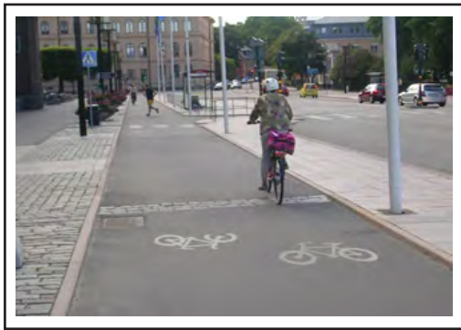
شکل ۳. کفسازی مناسب محور دوچرخه شهری در استکهلم سوئد و بهبود سلامتی شهروندان