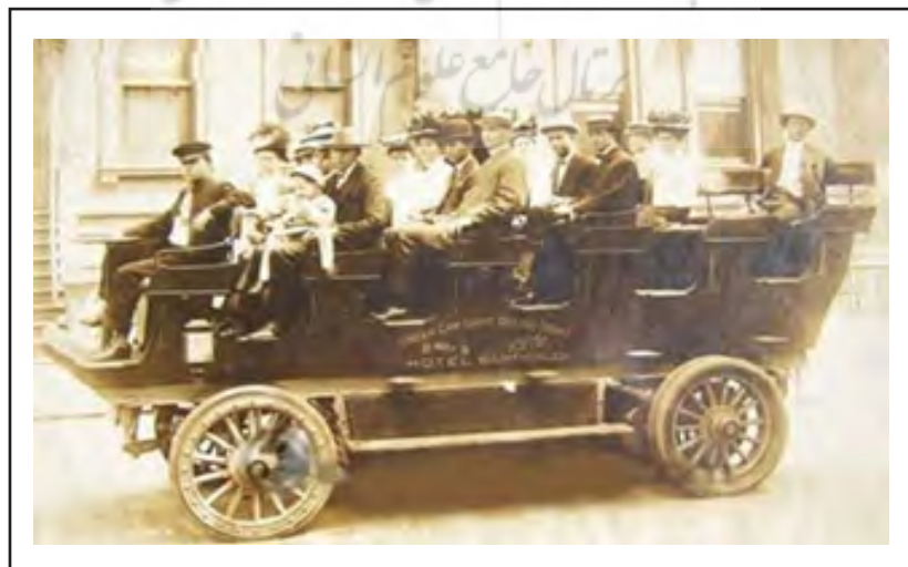
شکل ۶. ماشین حمل و نقل عمومی (۱۹۰۱ آلمان)