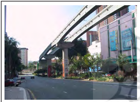
شکل ۵. استفاده از سیستم های جدید مونوریل در کوالالمپور