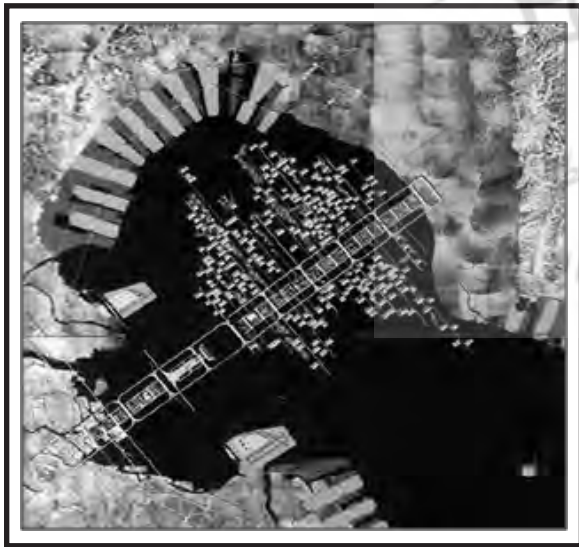
تصویر ۲: طرح تانگه برای خلیج توکیو

پروژه کنزو تانگه در خلیج توکیو، به خوبی رویکرد متابولیست‌ها را به شهر و ساختار شهر نشان می‌دهد. طرح او از استخوان بندی موجود شهر سرچشمه می‌گیرد و گام به گام تکمیل و اصلاح می‌شود. این پروژه، شامل یک ساختار خطی قابل گسترش است که به واحدهای ساختاری کوچک‌تر تقسیم می‌شود. (تصویر شماره ۲). این پروژه، ایده و تفکر جدید او را از طراحی شهری، یعنی همان ساختارگرایی، نشان می‌دهد.