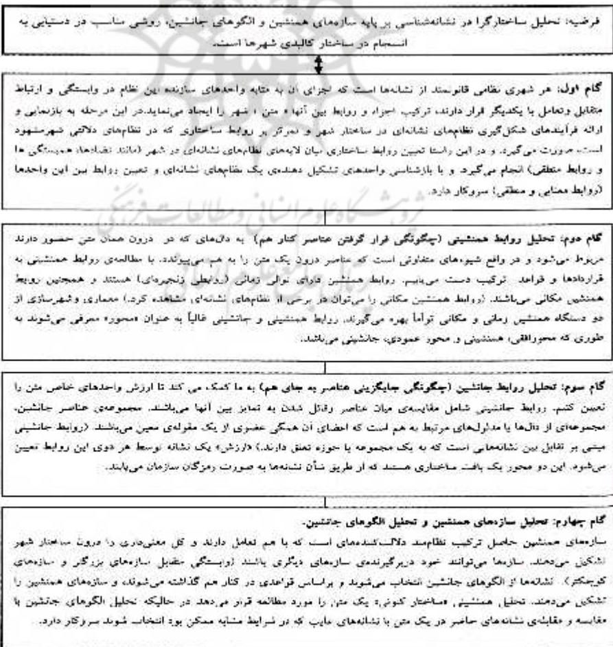
نردبان ۱ روابط میان مفاهیم (بر گرفته از چارچوب نظری تحقیق) در مدل تحلیلی

در حالی که تحلیل هم‌نشینی «ساختار کنونی» یک متن را مورد مطالعه قرار می‌دهد تحلیل جانشینی به دنبال تشخیص مجموعه‌های جانشینی مختلفی (یا مجموعه‌های از پیش موجود) است که نشانگر محتوای متون هستند توجه نشانه‌شناسان اغلب بر این موضوع است که چرا در یک بافت به خصوص یک دال خاص در مقابل دال‌های دیگری که امکان حضورشان بوده است، مورد استفاده قرار می‌گیرد. توجه آنها بر چیزی است که اغلب به آن «غیاب» گفته می‌شود. تحلیل جانشینی شامل مقایسه‌ی هر کدام از دال‌های حاضر در متن با دال‌های غایبی است که در موقعیتی مشابه امکان انتخاب آنها به جای دال حاضر وجود داشت. این تحلیل