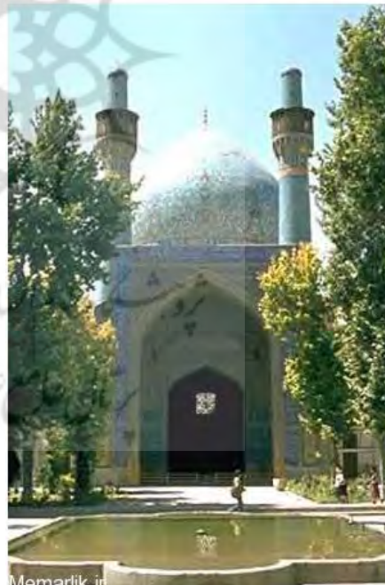
تصاویر 10 و 11 - مدرسه چهار باغ اصفهان - 1398