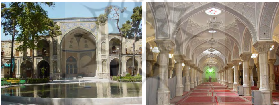
تصاویر 6 و 7- مسجد و مدرسه‌ی عالی سپهسالار (شهید مطهری) ضلع شرقی حیاط و شبستان زمستانی

معماری و تزئیناتی و ترکیبی از حجم‌ها و اندام‌های متناسب به هم تنیده شده‌اند، عناصر مختلفی مانند سردر و هشتی ورودی، صحن مرکزی، مقصوره و شبستان‌ها از جمله این عوامل می‌باشند. حضور طبیعت در ارتباط با فضاهای داخلی، در آرامش بخشی و کاهش استرس افراد اثر دارد. بنا به اعتقاد هیتینگ، طبیعت با ایجاد یک لذت بصری، استرس را کاهش می‌دهد و در نهایت احساس مثبتی ایجاد می‌کند که اندیشه‌های منفی را محدود می‌کند. آزمایش‌ها نشان داده است که حضور گیاهان سازگار با محیط کلاس درس عملکرد دانش آموزان را بهبود می‌بخشد. در حقیقت، مردم طبیعت و ساخته‌های طبیعی را به مناظر مصنوعی ترجیح می‌دهند و طبیعت را تأمین‌کننده نیازهای جسمی و روانی خود می‌دانند. نگاه به مناظر جذاب و سرسبز گیاهان برخی از بیماری‌های روحی و روانی را از بین می‌برد و افسردگی‌ها و غم‌ها را می‌زداید.