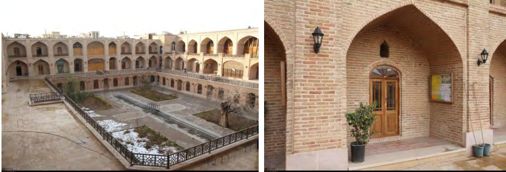
تصاویر 4 و 5 - مسجد و مدرسه صالحیه قزوین