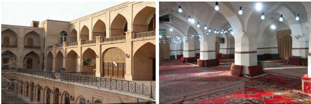
تصاویر 8 و 9 - مسجد و مدرسه صالحیه قزوین

قرار گرفته‌اند. فضاهای اصلی بنا که در واقع همان مدرس‌ها می‌باشند در محورهای اصلی بنا جای گرفته‌اند. همچنین وجود فضای نیایشی در کنار فضای آموزشی از جمله عوامل مؤثر بر آرامش افراد در معماری مدارس ایرانی - اسلامی بوده است.