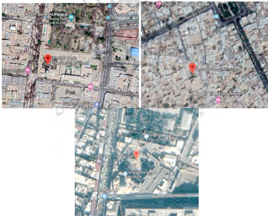
تصاویر 1، 2 و 3 - موقعیت و مکان‌یابی مسجد و مدرسه آقابزرگ کاشان، مدرسه چهارباغ و مدرسه عالی شهید مطهری

می‌آید، دیده می‌شود. این مکان هم به عنوان عبادت گاه و هم به عنوان محل آسایش و تحصیل طلاب مورد استفاده بوده است. بنای مسجد و مدرسه آقابزرگ کاشان در داخل بافت تاریخی و کهن شهر و در مجاورت بقعه خواجه تاج‌الدین واقع شده است. همچنین مدرسه چهارباغ آخرین بنای باشکوه و پر از ظرایف عهد صفویه در اصفهان است که برای تدریس و تعلیم طلاب علوم دینی در دوره شاه سلطان حسین ساخته شده و امروزه نیز به همین منظور مورد استفاده قرار می‌گیرد. به نقل از سایت شهر اصفهان، در شمال مدرسه چهارباغ بازارچه‌ای زیبا و مرتفع وجود دارد که در عصر صفویه به علت همیمن ارتفاع زیاد بازارچه بلند و به خاطر شکوه آن بازارچه شاهی نامیده می‌شده است. سرای فتحیه یا کاروانسرای مادر شاه نیز در شرق مدرسه چهارباغ واقع شده که مجلل‌ترین اقامتگاه مسافرین طی سه قرن پیش بوده و از لحاظ سبک معماری در بین هتل‌های دنیا در زمان حاضر نیز بی‌نظیر و منحصر به فرد است.