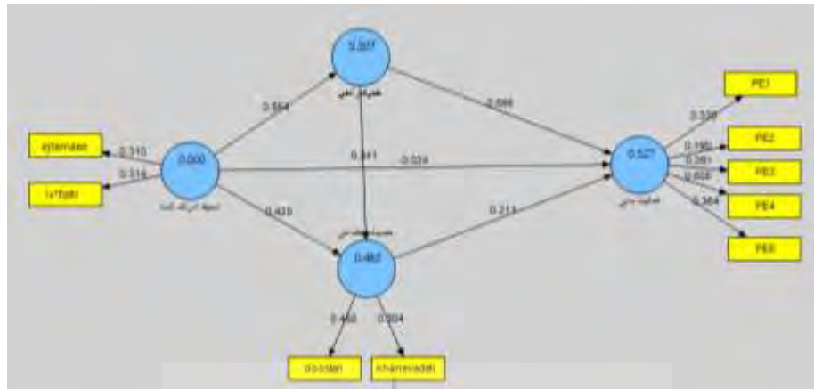
شکل ۲- الگوی نهایی پژوهش حاضر براساس مدلیابی معادلات ساختاری و ضرایب مسیر برای هر مسیر

در شکل شماره دو، ضرایب مسیر الگوی نهایی پژوهش حاضر مشاهده می‌شوند. همچنین، ضرایب مسیر و سطح معناداری آن‌ها در الگوی نهایی، در جدول شماره سه نشان داده شده‌اند. جدول شماره سه ضرایب مسیر و معناداری آن‌ها را نشان می‌دهد. براساس این جدول، مسیرهای مستقیم محیط ادراک شده به حمایت اجتماعی ( \beta = 0/43 , P = 0/001 )، محیط ادراک شده به خودکارآمدی ( \beta = 0/55 , P = 0/001 )، خودکارآمدی به مشارکت در فعالیت بدنی ( \beta = 0/60 , P = 0/001 ) و نیز مسیر مستقیم جدید حمایت اجتماعی به خودکارآمدی ( \beta = 0/34 , P = 0/001 ) معنادار هستند. مسیرهای مستقیم محیط ادراک شده به مشارکت در فعالیت بدنی ( \beta = 0/1890 , P = 0/001 ) و حمایت اجتماعی به مشارکت در فعالیت بدنی ( \beta = 0/21 , P = 0/070 ) معنادار نبودند و در الگوی نهایی حذف شدند.