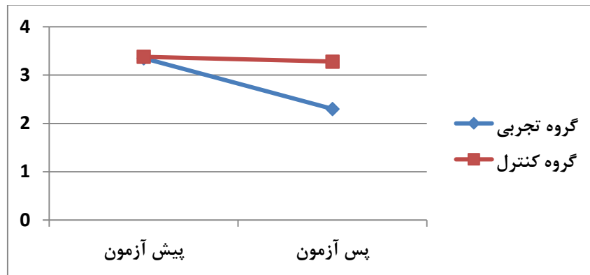
نمودار ۱. تغییرات استرس شغلی دو گروه تجربی و کنترل از پیش آزمون تا پس آزمون

جدول ۴. نتایج آزمون تی مستقل: مقایسه تغییرات استرس شغلی از پیش آزمون تا پس آزمون در دو گروه تجربی و کنترل