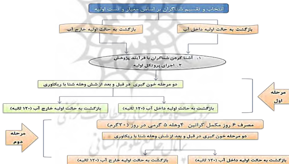
نمودار ۱. طرح شماتیک مراحل مختلف اجرای پژوهش حاضر

هر شناگر در دو جلسه آشنایی با پروتکل فعالیت شامل اجرای یک دوره (ست) شنای سرعتی ۵۰ متری ۶ تکرار، در طی یک هفته قبل از شروع مرحله اصلی شرکت می کند. فاصله استراحتی ۱۲۰ ثانیه ای در بین ۶ وهله شنای سنگین ۵۰ متری اجرا شد. به آزمودنی ها آموزش داده شد تا ریتم ریکاوری تخصصی یا داخل آب را به طریقی که توپکیس و همکاران (۲۶) و همچنین کازورلا و همکاران (۲۷) گزارش کردند و برابر با ۶۰ درصد بهترین رکورد ۱۰۰ متر هر فرد است، پیروی کنند. به علاوه، آزمودنی های گروه ریکاوری خارج آب نیز حداکثر ۱۰ ثانیه پس از اتمام وهله های شنای سرعتی از آب خارج شده و با توجه به روش کارونن و با شدت ۶۰ درصد حداکثر اکسیژن مصرفی از پیش تعیین شده برگشت به حالت اولیه را آغاز کردند. سپس همین آزمودنی ها به فاصله یک هفته پس از اجرای آزمون مرحله اول (قبل از مکمل گیری کراتین) برنامه مشابه وهله های مکرر شنای سرعتی همراه با برگشت به حالت اولیه فعال داخل یا خارج آب را پس از اتمام دوره مکمل کراتین اجرا کردند. عملکرد افراد در طی اجرای وهله های تناوبی شنا با سرعت بالا توسط دو نفر ثبت و میانگین آن به عنوان رکورد هر وهله از تکرارها ثبت شد (نمودار ۱).