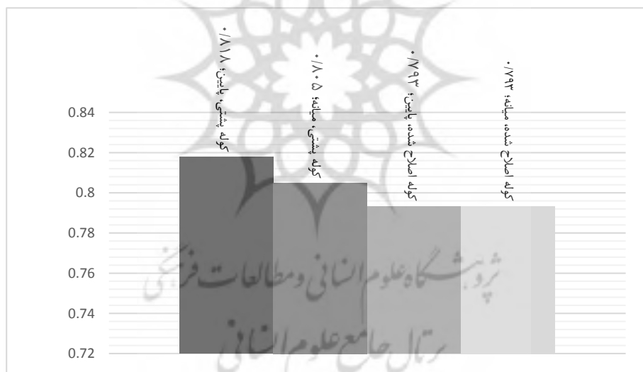
نمودار ۲ تفاوت میانگین حداقل نیروی عمودی بین پایین و میانه پشت در دو کوله