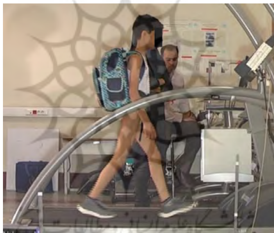
تصویر ۲. حمل کوله پشتی با ۱۰ درصد وزن بدن در وضعیت پایین

پس از اندازه‌گیری‌ها و استخراج داده‌ها، با ورود داده‌های اصلی به نرم‌افزار اکسل فرایند محاسباتی و استخراج داده‌های نهایی متغیرهای هدف، انجام گرفت. برای متغیرهای کینماتیکی گیت از داده‌های فایل خروجی دستگاه استفاده شد، ولی برای متغیرهای کینتیکی، ابتدا داده خام سیکل‌های انتخاب شده با باتروورث پایین گذر ۶ هرتز فیلتر شد، سپس داده‌ها استخراج و تحلیل شد. میانگین سه سیکل از کل