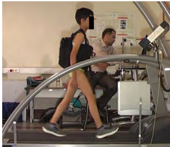
تصویر ۱. حمل کوله اصلاح شده با ۱۰ درصد وزن بدن در وضعیت پایین