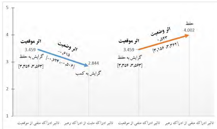
شکل ۳. نمودار مدل پیش‌بینی‌کننده رفتار، مبتنی بر تعاملات ادراکی رهبر-پیرو با رویکرد حفاظت از منابع در موقعیت تهدید. اختیار و کنترل شغلی در سازمان

مدل آمیخته به‌دست‌آمده در این پژوهش با لحاظ حالات ادراکی مختلف و در نظر گرفتن اثر تصادفی میان افراد، اثر وضعیت و همچنین اثر موقعیت، قادر است مختصات تمایل رفتاری کارکنان بانک‌های دولتی و شبه‌دولتی کشور را در شرایط حضور و عدم حضور ادراکات مختلف از ادراک رهبر، در موقعیتی که فرد، آن را به‌مثابه تهدیدی برای اختیار و کنترل شغلی خود می‌پندارد، پیش‌بینی کند. با توجه به شکل ۳، وقتی فرد ادراک منفی از موقعیت دارد، تمایل رفتاری او در صورت عدم حضور ادراک از ادراک رهبر با احتمال ۹۵ درصد به سمت تمایل رفتاری «گرایش به حفظ» خواهد بود؛ به‌عبارت‌دیگر در صورتی که ادراک از ادراک رهبر وجود نداشته باشد، گرایش به اقدام فعالانه در جهت حفظ اختیار و کنترل شغلی در مقابل تهدید از دست‌روی آن، تمایل رفتاری غالب فرد خواهد بود. تمایل به حفظ اختیار و کنترل شغلی کاملاً همسو با این دیدگاه هابفال (۲۰۱۸)، است که افراد سعی در حفاظت از چیزهایی دارند که برای آن‌ها ارزش قائل هستند. این تمایل رفتاری کاملاً همسو با این نکته است که زمانی که افراد احساس می‌کنند منابع اصلی یا کلیدی آن‌ها دست‌خوش تهدید از دست‌رفتن می‌شود، دچار تنش می‌شوند و تنش ایجادشده بر شیوه مصرف منابع آن‌ها تأثیر می‌گذارد (Hobfoll 1988, 1998, 2018).