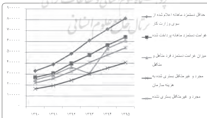
نمودار ۱: تغییرات غرامت دستمزد ایام بیماری و حداقل حقوق ماهیانه از سال ۱۳۹۰ تا ۱۳۹۵

* ارقام این ردیف برگرفته از گزارش هزینه درآمد خانوار شهری مرکز آمار ایران (۱۳۹۶ - ۱۳۹۱) است.