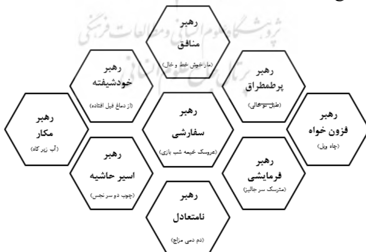
شکل ۳. الگوهای ذهنی مشارکت‌کنندگان پژوهش درباره خروج از خط رهبری سازمانی

شکل ۳ به طور خلاصه الگوهای ذهنی کشف شده از کارکنان دانشگاه ولی‌عصر (عج) را درباره پدیده خروج از خط رهبری، به پیوست استعاره‌های متناظر با آنها نشان می‌دهد.