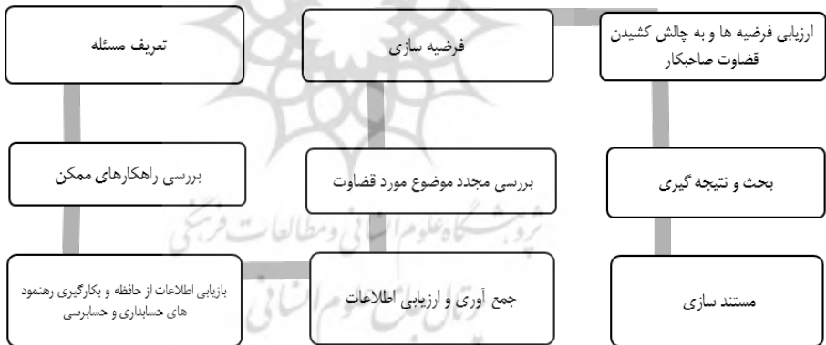
شکل ۲: چارچوب قضاوت حسابرسان

به‌منظور اطمینان از محتوای تئوریک و همچنین کاربرد عملی چارچوب قضاوت حرفه‌ای حسابرسان در ایران پرسشنامه‌های جداگانه‌ای تهیه و برای صاحب‌نظران ارسال گردیده، در ادامه نتایج تحلیل پرسشنامه‌های یادشده بیان می‌گردد.