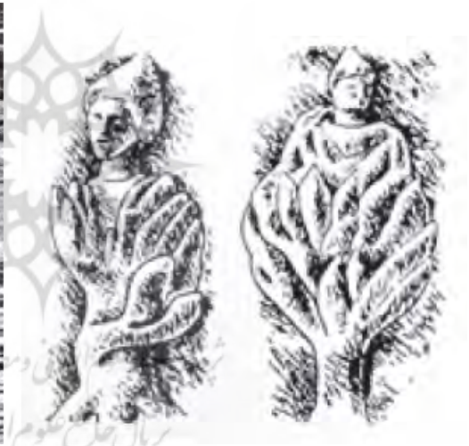
تصویر ۱: زایش مهر از میان نیلوفر (آموزگار، ص ۲۲)

در تصویر شمارهٔ دو گل نیلوفر را در کنار ایزدبانوی مادر در اینجا «اشی» خواهر سروش نشان داده‌اند. تمام زنانی که می‌خواستند بارور شوند. تصویر این ایزدبانو را در حالی که در حال به دنیا آوردن نوزادی است روی صفحهٔ مدوری از برنز یا طلا (یا به‌عنوان سنجاق) نشان می‌دادند و به‌عنوان نذر به عبادتگاه تقدیم می‌کردند.