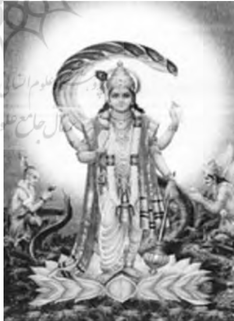
تصویر ۵: ویشنو با لوتوسی در دست (بلخاری قهی، ج ۲، ص ۴۲)

ویشنو برای نخستین بار در حجاری‌های گوپتا به طرزی مصور شده که روی آب‌ها دراز کشیده و خفته است. تخت او عبارت است از یک مار هزار سر و از ناف ویشنو گل نیلوفری می‌روید که برهما با آن نشسته است (همو، ص ۱۹۵). او خدای محافظ کائنات است. موجودیت جهان و هویت‌های موجود آن متکی به اوست. در تصویر شماره پنج ویشنو با نیلوفری در دست نشان داده شده است.