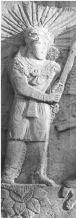
تصویر ۳: سمت راست: پیکره ایزد مهر روی گل نیلوفر در طاق بستان (بلخاری، ج ۲، ص ۴۳)

روابط میان هند و ایران در عصر هخامنشیان مستند است و ایران به‌طور مستقیم یا غیرمستقیم نه‌تنها شیوه‌های شاهنشاهی، بلکه مهارت‌ها و فواید مهمی را به دولت‌های محلی دره گنگ انتقال داده است. حتی پس از فتح اسکندر روابط دوستانه میان ایران و هند ادامه یافت. مگاستنس ۴۰ یا ۵۰ سال پس از سقوط تخت جمشید و شوش است. تالاری با ۸۰ ستون در پاتالی پوترا پیداست که براساس آپادانا ساخته شده بود. ستون‌های سنگی بزرگشان در هند برای اول بار بود و بناها در باغی بزرگ با درختان و چشمه‌ها قرار داشت که یادآور پردیس‌های ایرانی بود، به‌ویژه این امر در خور توجه است که ستون‌های این بناهای هندی همه، تراش ایرانی را نشان می‌دهد. یکی از سرستون‌های باقی‌مانده دقیقاً به سبک هخامنشی حجاری شده است. نشانه‌های سرمشق‌ها و سبک‌های ایرانی در هند، در دوران پادشاهی آشوکا (۲۲۷-۲۶۴ ق. م) متنوع‌تر و فراوان‌تر است. استفاده از سرستون‌هایی به شکل جانوران مانند ساونات (۲۴۵ ق. م) و جام‌های نیلوفر وارونه به شکل پایه ستون‌های هخامنشی است و در آنجا به‌صورت سرستون درآمد است (یوپ، ج ۹، ص ۴۵).