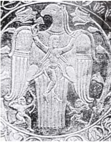
تصویر ۲: آنهایتا در پناه عقاب آسمان، اواخر ساسانی (بلخاری، ج ۲، ص ۳۹)

شمارهٔ یک زایش مهر از میان نیلوفر را نشان می‌دهد. آب و پاکیزگی از فصول مشترک صفات ناهید و نیلوفر است که این دو را به هم پیوند می‌دهد. ظاهراً ماده‌ها نخستین ایرانیانی هستند که به عنصر آفرینندهٔ آنهایتا امکان رشد داده‌اند. در میان اشیاء مفرغی لرستان نیز که مربوط به ۸۰۰ تا ۷۰۰ ق. م. است، نشانه‌هایی از آنهایتا به چشم می‌خورد. این ایزدبانو با صفات نیرومندی، زیبایی و خردمندی به صورت الههٔ عشق و باروری نیز درمی‌آید؛ زیرا چشمهٔ حیات از وجود او می‌جوشد و بدین گونه «مادر خدا» نیز می‌شود. تندیس‌های باروری را که به الههٔ مادر موسوم‌اند، تجسمی از این ایزدبانو می‌دانند (آموزگار، ص ۲۱) که در تصویرها با کوزهٔ آبی که بر شانه دارد نشان داده شده است.