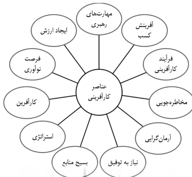
شکل ۱- عناصر کارآفرینی

محققان و صاحب‌نظران، عناصر گوناگونی را برای کارآفرینی ذکر کرده‌اند. در جمع‌بندی از تعاریف و تئوری‌های مختلف ارائه‌شده می‌توان عناصر کارآفرینی را در شکل (۱) نشان داد: