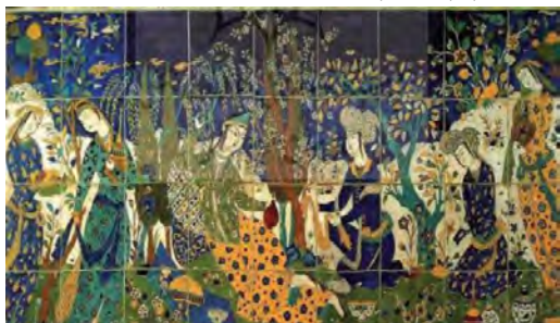
شکل ۴- کاشی هفت‌رنگ، دوره‌ی شاه عباس، موزه ویکتوریا و آلبرت

دوره صفوی، نقاشی‌های دیواری است که روی گچ و یا به صورت پرده‌های رنگ روغنی انجام شده و بر قاب‌های دیوار، نصب می‌شده است. به موازات کاشیکاری، نقاشی روی گچ در تزیینات نماهای داخلی اهمیّت ویژه‌ای داشته که در بسیاری از بناهای خصوصی و عمومی دوره‌ی صفویّه به چشم می‌خورد. این نقاشی‌ها با پس زمینه‌هایی از مناظر اروپایی در ابعاد بزرگ و بیشتر برای زینت بخشیدن به فضای داخلی کاخ‌ها مورد استفاده قرار می‌گرفت. از این نمونه نقاشی‌ها می‌توان به تزیینات کاخ‌های چهلستون و عالی‌قاپو اصفهان و قزوین اشاره کرد (جوادی؛ ۱۳۸۵: ۶-۱۸). (شکل ۳) همچنین در این دوره، به علّت ارتباط دربار صفوی با کشورهای خارجی، رونق فرهنگی و بازرگانی و آمد و شد هنرمندان و تجار از شرق و غرب، تحولاتی در نقش‌پردازی پدید آمد و عناصری از هنر اروپا و چین به نقوش ایرانی راه یافت (جوادی؛ ۱۳۸۵: ۶-۱۸). (شکل ۴)