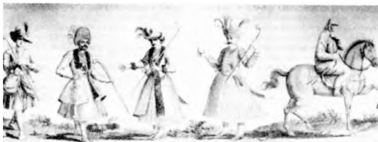
شکل ۵- پوشاک ایرانیان در قرن هفدهم میلادی

ترک با یک آرایه ته مناری بلند و نوک تیز پیچیده می‌شد، که زیر آن عرقچین صافی ۱ می پوشیدند. کلاه در اکثر موارد قرمز بود ولی گاهی رنگهای دیگری برای تطابق با کل پوشاک پوشیده می شد(متین؛ ۱۳۸۳: ۱۹۷).