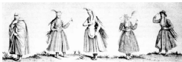
شکل ۸- پوشاک زنان ایرانی، قرن ۱۷ میلادی

در این دوران زنان انواع زیرپوش‌های راه‌راه یا چهارخانه‌ی نازک به تن می‌کردند و پیراهن را با زیر شلواری‌های ساده یا راه‌راه جذاب که تا به زمین می‌رسید، می‌پوشیدند و گاهی یقه را با مروارید، حاشیه‌دوزی می‌کردند. سپس انواع جدیدی از لباس‌ها ارائه گردید که پوشش زنان را نیز دستخوش تغییراتی نمود. ردای کوتاه‌تری همراه با چکمه‌های کوتاه و زربفت حاشیه‌دوزی پوشیده میشد که تا ۸ یا ۱۰ سانتی‌متری بالای قوزک پا می‌رسید و نیم تاجی مثلث شکل و زربفت که با انواع رو بنده‌ها پوشیده می‌شد، متداول گردید. انواع جدید چادر نیز به‌وجود آمد که یک نوع آن مانن کیسه در بالا گره می‌خورد و نوع دیگر روبنده‌ی توری داشت که به دو طرف پیشانی وصل می‌شد. لباس زنان فاخرتر از لباس مردان بود. این لباس مانند لباس مردانه و به صورت یکسره بود. آستین‌ها به دست و بازو چسبیده بود و روی میج دست محکم می‌شد. کلاه کوچکی به شکل برج به سر می‌گذاشتند و هر کس مناسب با مرتبه و مقام و بضاعتش آن را با جواهرات مختلف و سنگ آرایش می‌داد (پارشاطر، ۱۳۸۳، ۱۹۳-۲۳۶). در ادامه قرن هفدهم میلادی، انواع جدیدی از لباس‌های اصلی ارائه گردید. رداها و بالا پوشهای مردان بتدریج کوتاه‌تر می‌شد. چشم‌گیرترین تغییر در دوخت ردا بود که پوششی بود در بالاتنه چسبان و در ناحیه باسن و سراسنینه محکم آجیده شده، همراه با دامنی کلوش و چتری شکل در پایین. آستینها مچهای نوک تیزی داشتند(متین؛ ۱۳۸۳: ۲۰۳).