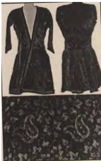
شکل ۱۱- قبای مخمل مربوط به دوره صفویه

یکی دیگر از مشخصات ظاهری لباس ایرانی تقارن خطوط و برشهای آن است؛ یعنی طرفین لباس قرینه هستند و این قرینگی را در تمام زمینه های هنری ایران از جمله معماری به وضوح شاهد هستیم.