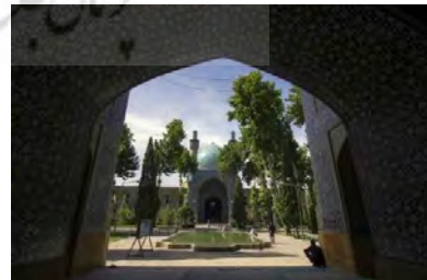
شکل ۲- مدرسه مادر شاه اصفهان