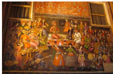
شکل ۳- تزیینات، نقاشی چهل‌ستون اصفهان