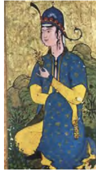
شکل ۹- «شاهزاده خانم نشسته»، منسوب به میر سید علی. سال ۹۴۷ق