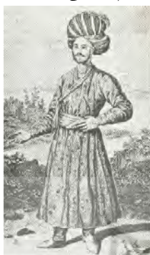
شکل ۷- قبای مردان صفوی (سیوری، ۱۳۷۲: ۲۷)