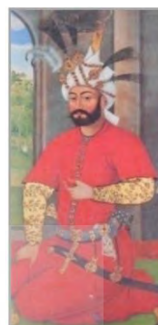
شکل ۶- شاه طهماسب با پیراهن گلدار، (آقاجانی و همکاران، ۱۳۸۶: ۷۰)

در این دوران زنان انواع زیرپوش‌های راه‌راه یا چهارخانه‌ی نازک به تن می‌کردند و پیراهن را با زیر شلواری‌های ساده یا راه‌راه جذاب که تا به زمین می‌رسید، می‌پوشیدند و گاهی یقه را با مروارید، حاشیه‌دوزی می‌کردند. سپس انواع جدیدی از لباس‌ها ارائه گردید که پوشش زنان را نیز دستخوش تغییراتی نمود. ردای کوتاه‌تری همراه با چکمه‌های کوتاه و زربفت حاشیه‌دوزی پوشیده میشد که تا ۸ یا ۱۰ سانتی‌متری بالای قوزک پا می‌رسید و نیم تاجی مثلث شکل و زربفت که با انواع رو بنده‌ها پوشیده می‌شد، متداول گردید. انواع جدید چادر نیز به‌وجود آمد که یک نوع آن مانن کیسه در بالا گره می‌خورد و نوع دیگر روبنده‌ی توری داشت که به دو طرف پیشانی وصل می‌شد. لباس زنان فاخرتر از لباس مردان بود. این لباس مانند لباس مردانه و به صورت یکسره بود. آستین‌ها به دست و بازو چسبیده بود و روی میج دست محکم می‌شد. کلاه کوچکی به شکل برج به سر می‌گذاشتند و هر کس مناسب با مرتبه و مقام و بضاعتش آن را با جواهرات مختلف و سنگ آرایش می‌داد (پارشاطر، ۱۳۸۳، ۱۹۳-۲۳۶). در ادامه قرن هفدهم میلادی، انواع جدیدی از لباس‌های اصلی ارائه گردید. رداها و بالا پوشهای مردان بتدریج کوتاه‌تر می‌شد. چشم‌گیرترین تغییر در دوخت ردا بود که پوششی بود در بالاتنه چسبان و در ناحیه باسن و سراسنینه محکم آجیده شده، همراه با دامنی کلوش و چتری شکل در پایین. آستینها مچهای نوک تیزی داشتند(متین؛ ۱۳۸۳: ۲۰۳).