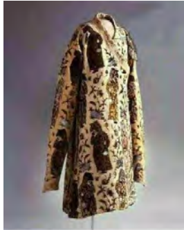
شکل ۱۰- بالا پوش مخمل با زمینه‌ی زربفت. ایران حدود سال ۱۷۳۰م