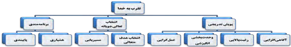
شکل ۱. دیاگرام اجمالی مؤلفه‌های تقرب به خدا

در تدوین مدل مفهومی تقرب به خدا، ابتدا به تبیین مؤلفه‌ها و زیرمؤلفه‌ها و روابط بین آنها پرداخته و در نهایت، الگوی تقرب به خدا بر اساس اندیشه علامه طباطبائی ارائه خواهد شد.