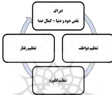
شکل ۳. فرایند پویای و تغییر تدریجی

به تدریج به سمت کمال حقیقی خود حرکت می‌کند؛ به این صورت که عبودیتی که ناشی از محبت پروردگار است، فرد را به درجات قرب و کمال می‌رساند. در چنین حالتی بین شناخت، عواطف، انگیزش و رفتار فرد، یکپارچگی و انسجام ایجاد می‌شود و همه ابعاد وجودی او بر یک هدف متعالی متمرکز می‌گردد و به تدریج، به کمال نهایی خود نزدیک می‌شود. از این رو، در تبیین و مفهوم‌پردازی تقرب به خدا، به مفهوم پویای تدریجی دست می‌یابیم که این حرکت و فعالیت مستمر تدریجی، در قالب چهار حوزه وجود انسان تحقق می‌یابد و انسان را در مسیر کمال و شکوفایی استعدادهای خویش قرار می‌دهد.