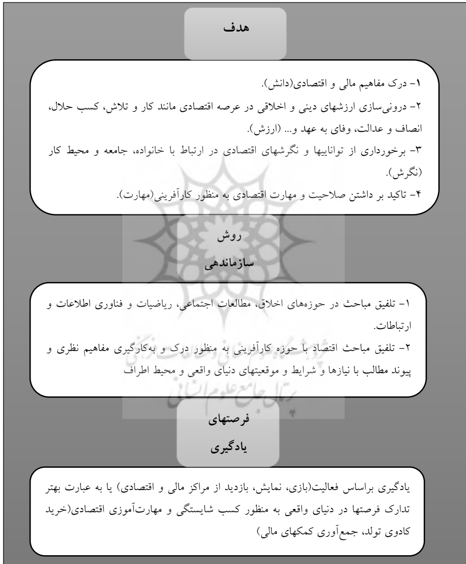
شکل ۲: مرحله مقایسه و تطبیق

و سرانجام در مرحله مقایسه و تطبیق، ویژگیهای آموزشی نواحی مورد مطالعه با ناحیه خود (کشور ایران) مورد مقایسه و انطباق قرار می‌گیرد (معدن‌دار آرانی و کاکیا، ۱۳۹۷). لذا مؤلفه‌های مستخرج از برنامه‌های درسی و اسناد آموزشی کشورهای چین، اسکاتلند، استرالیا و ایران پس از طی مراحل مذکور در الگوی بردی در قالب شکل ۲ ارائه شده است.