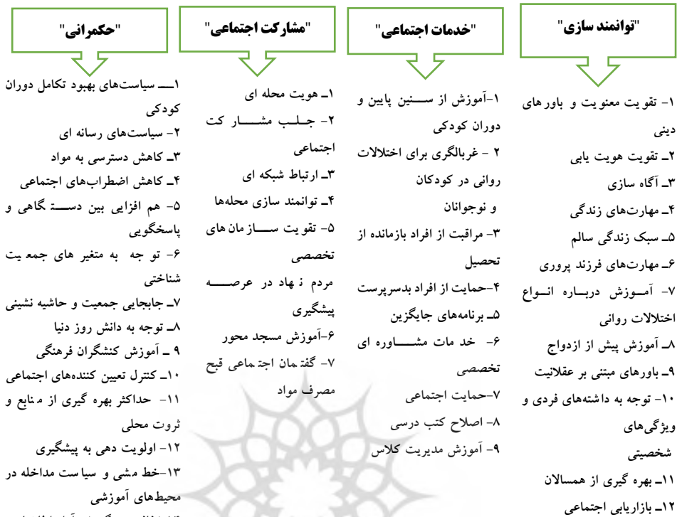
شکل ۱: عوامل چهارگانه و زیرمؤلفه‌های آن

راند دوم دلفی: مشخص نمودن اتفاق نظر خبرگان نسبت به ترتیب اهمیت عوامل تأثیرگذار بر مدیریت راهبردی پیشگیری اولیه از اعتیاد با رویکرد فرهنگی: در راند دوم و نیز راندهای بعدی، به منظور مشخص نمودن اتفاق نظر خبرگان نسبت به ترتیب اهمیت عوامل تأثیرگذار بر مدیریت راهبردی پیشگیری اولیه از اعتیاد با رویکرد فرهنگی، پرسش‌نامه ساخت یافته‌ای از عوامل چهارگانه و متغیرهای ذیل آن‌ها براساس طیف لیکرت ۱۰ درجه‌ای (صفر کاملاً مخالف تا ۹ کاملاً موافق) تنظیم و مجدداً برای ارزیابی در اختیار اعضاء خبرگان قرار گرفت. داده‌های استخراج شده براساس آمارهای توصیفی و ضریب هماهنگی کندال (W) در راستای دست‌یابی به اتفاق نظر و اطمینان نسبت به ترتیب اهمیت عوامل، مورد تحلیل قرار گرفت.