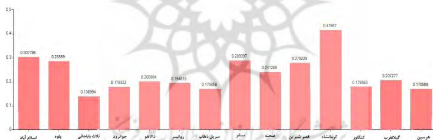
شکل شماره ۳. مقایسه عملکرد الترناتیوها

نمودار زیر مقایسه‌ای بین الترناتیوها را نشان می‌دهد.