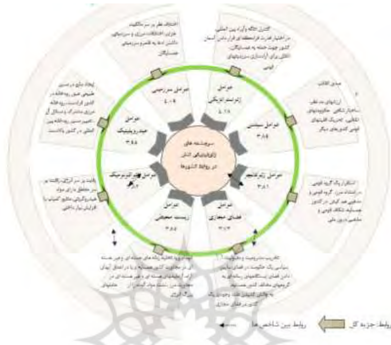
شکل ۳. الگوی عوامل ژئوپلیتیکی تنش در روابط کشورها

اگر چه هر گروه از این عوامل ژئوپلیتیکی تنش را می توان به صورت جداگانه و منفرد نیز مورد بررسی و مطالعه قرار داد، ولی با این حال، هر کدام از این متغیرها بر سایر عوامل و متغیرها نیز تأثیرگذار بوده و در فعال کردن یکدیگر نقش بسزایی دارند. ضمن آن که تعداد زیادی از متغیرهای ژئوپلیتیکی که از قابلیت ایجاد تنش و منازعه بین دولتها برخوردارند و در مدل ارائه شده برای این پژوهش در ذیل یک گروه از عوامل ژئوپلیتیکی قرار گرفته اند، به لحاظ موضوعی ممکن است همزمان به چند گروه از این عوامل هشت گانه تعلق داشته باشند. به عبارتی از یک حالت سیالیت برخوردارند. این ویژگی مخصوصاً در بین متغیرهای مربوط به عوامل سرزمینی، ژئواکونومیک، هیدروپلیتیک و ژئواستراتژیک بیشتر نمایان است. علاوه بر این در این مدل سعی شده است که عوامل غیر سنتی تهدیدکننده دولتها نظیر مسائل مربوط به عوامل زیست محیطی و