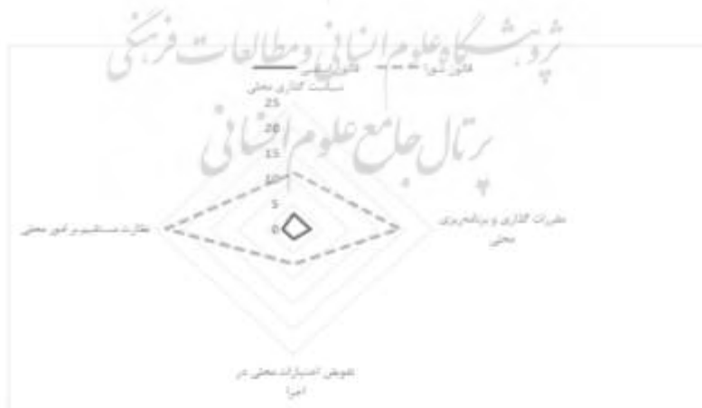
نمودار ۱. توزیع فراوانی زیرمقوله‌ها به تفکیک قوانین

در مقایسه میان وضعیت تمرکززدایی در قانون اساسی و قانون شوراها نمودار شماره ۱ ترسیم شده است. شکل بدست آمده بیانگر آن است که قوانین مذکور به طور نسبی به هر چهار زیرمقوله‌ی ارزیابی میزان تمرکز پرداخته است اما در قانون اساسی نظر قانون‌گذار بیشتر به سمت سیاست‌گذاری محلی و مقررات‌گذاری و برنامه‌ریزی محلی است که امکان قدرت‌سپاری را به مدیریت محلی فراهم می‌کند. در حالی که در قانون شوراها مشاهده می‌شود که قانون‌گذار بیش از همه بر نظارت مستقیم بر امور محلی و سپس مقررات‌گذاری و برنامه‌ریزی محلی تاکید دارد و دو زیرمقوله دیگر در مراتب بعدی اهمیت قرار گرفته‌اند.