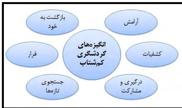
شکل ۱. انگیزه‌های گردشگران برای سفر کم‌شتاب

ارزیابی ژئومورفوسایت‌ها موضوعی است که انگیزه و علاقه جغرافی‌دانان سراسر دنیا را به تلاش برای تمرکز بر توسعه و حفظ روش‌های ارزیابی نشان می‌دهد؛ روش‌هایی ارزیابی که در گذشته عرضه کرده‌اند. این روش‌ها در تلاش برای شناسایی سایت‌ها و مکان‌های مستعد برای توسعه ژئوتوریسم و برنامه‌ریزی گردشگری و همچنین شناسایی مکان‌هایی‌اند که حفاظت از آنها ضروری می‌نماید (سلمانی و فرجی سبکیار، ۱۳۹۴: ۱۷۸). در چند دهه اخیر، روش‌های مختلفی برای ارزیابی ژئومورفوسایت‌ها معرفی شده که در آنها معیارها و ارزش‌های مختلفی برای ارزیابی توانمندی‌های ژئوتوریسم مناطق تعیین شده است. هر روش به کمک کارشناسان مختلف ژئوتوریسم و علوم زمین بررسی و ارزشیابی شد و پس از طی مراحل مختلف، در نهایت به‌مثابه روش ارزیابی معرفی شد (همان: ۱۷۹). در جدول ۱ می‌توان مهم‌ترین پژوهش‌ها در زمینه ارزیابی ژئومورفوسایت‌ها را مشاهده کرد.