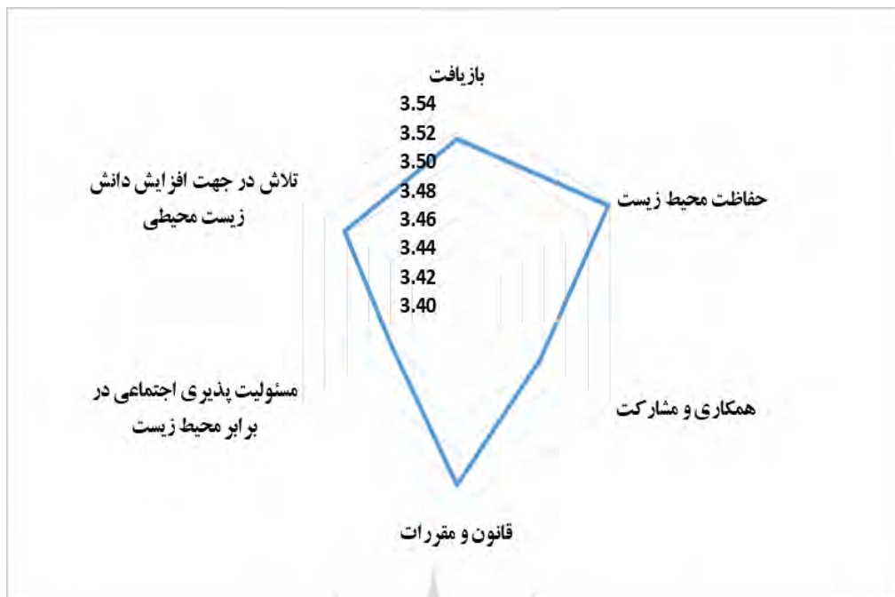
شکل ۳. میانگین عوامل رفتارهای زیست محیط‌گرایانه حاصل از تحلیل عاملی اکتشافی

جایکا بیشترین تغییر را در رفتار زیست محیطی روستاییان در روستای تبرک سفلی و کمترین تأثیر را در روستای گزستان داشته است. در روستای تبرک سفلی همان‌طور که از نام این روستا پیداست ۲ ، با اجرای طرح جایکا و افزایش دانش زیست محیطی عشایر، جایگزینی مشاغل دیگر و... تغییر نگرش و رفتار عشایر ملموس‌تر بوده است؛ در حالی که در روستای گزستان به علت آگاهی و نیز اشتغال بیشتر در سایر مشاغل همانند معادن اطراف، دامداری، کشاورزی، گیاهان دارویی و... این گونه نبوده است.